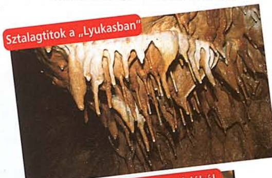
Sztalagtitok a „Lyukasban”