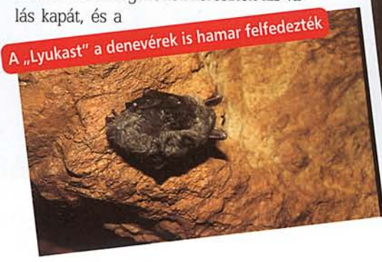
A „Lyukast” a denevérek is hamar felfedezték