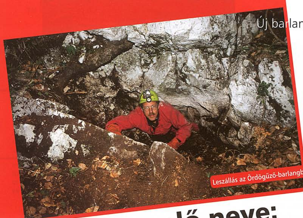
Leszállás az Ördögűző-barlangba

csoportot faképnél hagyva kb. száz méterrel távolabb kezdett önálló kutatásba. Már jó ideje vizsgált egy területet, mikor odaérem. Néhány hatalmas kőtömb eltávolítása után kicsi üreg nyílt meg, melybe kisebb köveket dobva sokat sejtető hosszú és egyre mélyülő koppanások hallatszottak. Gyorsan kötélért szaladtunk, és kisvártatva már a bejárat lehetőségét vizsgáltuk. A járatot elzáró hatalmas kőtömböt már öten próbáltuk eltávolítani, ami jó félóra múlva sikerült is, és rövidesen egy aknában találtuk magunkat. Néhány méter után egy szűkület következett, majd az akna kitágult, és csak kötéllal lehetett továbbjutni. Leereszkedve egy szép cseppköves terembe jutottunk, melynek alján a végpont jelenleg -20 méteren található. A barlang a feltárástban