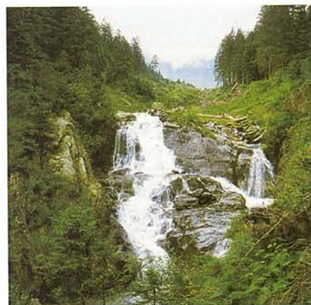
VADREGÉNYES ÚTVONAL A FOGARASI-HAVASOKBAN

A túrát a térképen jelölt szombatfalvi üdülőtelepről terveztünk indítani, feltételezve, hogy itt biztosan találunk sátorhelyet. Az üdülőtelep éttermében tájékoztattak, itt ugyan nincs kemping, de ha nagyon akarjuk, az udvaron felverhetjük a sátrakat. A hasraütés alapján ajánlott baráti árat nyomban el is fogadtuk, majd fizetés után a pincér a visszajáró összeg kétszeresét nyújtotta át, mondván elég lesz ennyi is. Fő a vendégszeretet! A kemping egyébként túlzottan magas színvonalat nem képviselt, a mosdóba csak az éttermen ke-