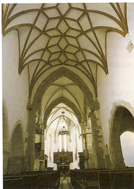
PRÁZSMÁR ERŐDTEPLOMA BELÜLRŐL

resztül lehetett bemenni, amit persze reggel zárva találtunk.