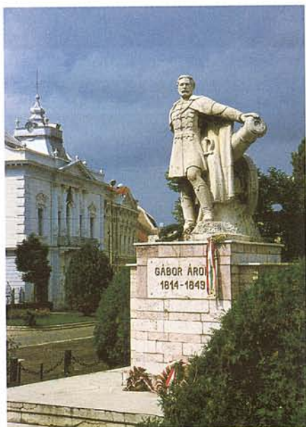
GÁBOR ÁRON SZOBRA KÉZDIVÁSÁRHELYEN

ázás után Kézdivásárhely következett, ahol Gábor Áron szobra is áll. A híres tűzértiszt a szabadságharc idején 64 ágyút önttetett a városban. Továbbhaladva érdekes erődített templomokkal találkozunk. Kiemelkedik közülük a 13. században épült prázmári templom, melyet a 15. században vettek körül fallal. Ma hat másik hasonló építménnyel – többek között a hazafelé felkeresett berethalmi templommal – együtt az UNESCO világörökség listáján szerepel. A szomszédos szászhermányi erődtemplom helyzete nem ilyen előkelő, de egy kis kitérőt mindenképpen megér. A sok megállás után már csak rövid brassói séta fért a