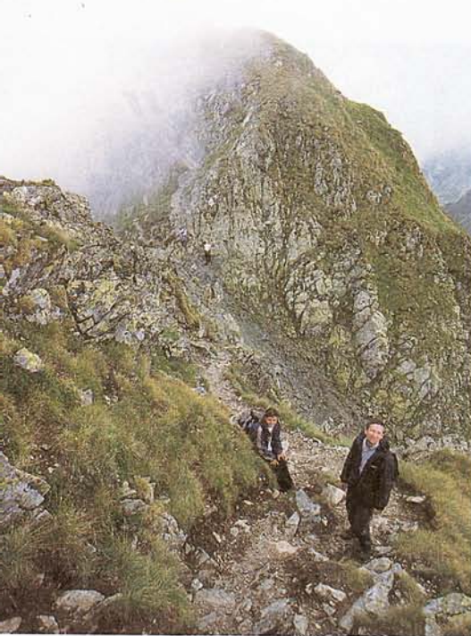
ÚTBAN A MOLDOVEANU FELÉ

tünk, messze van-e még kiszemelt célpontunk. Még egy fél óra a gerinc, onnan másfél a csúc – válaszolt a lány, és hozzátette „very dangerous”. Még mondott valamit, majd a „very dangerous”-t ismételve köszönt el.