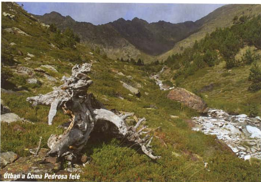
Útban a Coma Pedrosa felé

A következő napon már csak kisebb sétát tetünk a Madriu-völgybe, időnk döntő részét a főváros és környékének megtekintésére fordítottuk. Az 1030 méteren épült Andorra la Vella Európa legmagasabban fekvő fővárosának számít. Éles határa nincs, teljesen egybeépült vele a kis ország második legnépesebb települése, Les Escaldes. Patinás, régi épületek és modern üzletek váltogatják egymást, azon viszont még