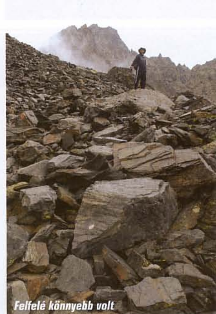
Felfelé könnyebb volt