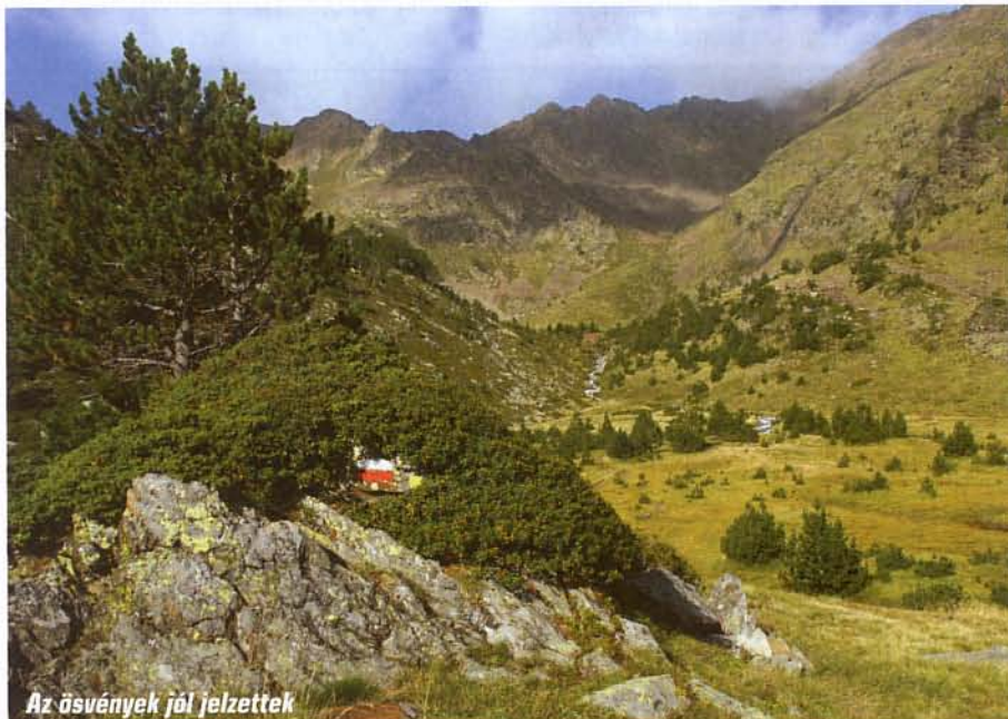
Az ösvények jól jelzettek

ösvény rövidesen kettéválik, a térkép alapján balra fordul az 1. számú, jobbra pedig a 2. és 3. közös út. Bal felé vettük az irányt, de a jelzéseket mindkét irányban jól lehetett követni. Egy kisebb tó, a Basses de l'Estany Negre mellett elhaladva újra választhatunk, a jobbra induló rövidebb gerincutat vagy az Estany Negre (Fekete-tó) melletti, kissé hosszabb utat követhetjük. Mi az előbbi mellett döntöttünk, s bár