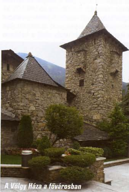
A Völgy Háza a fővárosban

„Mennyi cigarettát hoznak?” – kérdezte egy fiatal spanyol vámos, amikor a határra érkezünk. „Semmit, csak a Coma Pedrosán voltunk.” – válaszoltam. A hegy nevének említése varázserővel bírt. Épp csak rápillantottak a csomagunkra, és már indulhattunk is vissza Barcelonába. Rövid látogatásunk aligha járult hozzá számottevően Andorra gazdaságának felvirágzásához, a kedvező adózási lehetőségeket azonban sokan kihasználják. Ki kicsiben – ki nagyban. Talán nem véletlen, hogy szinte minden nagy gazdasági potenciállal rendelkező állam szomszédságában megbújik egy kis „Andorra.” Legfeljebb a neve más... ■