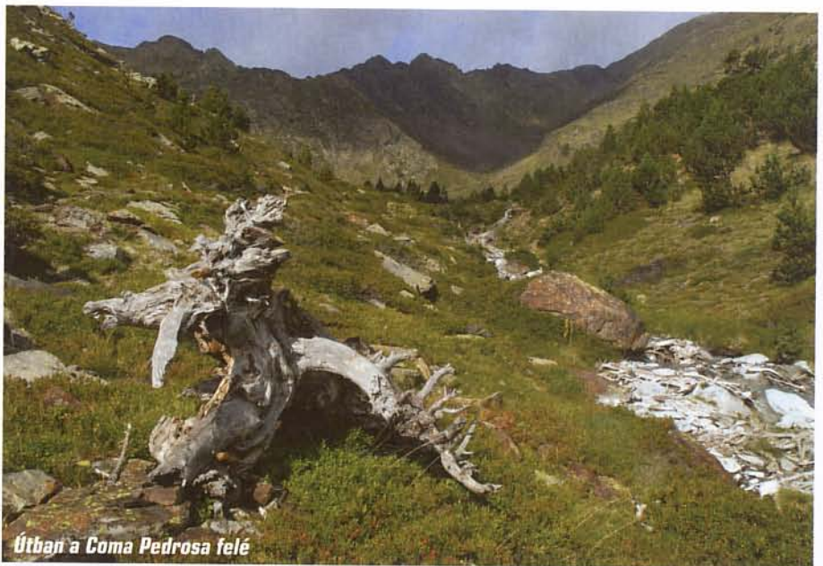
Útban a Coma Pedrosa felé

A következő napon már csak kisebb sétát tetünk a Madriu-völgybe, időnk döntő részét a főváros és környékének megtekintésére fordítottuk. Az 1030 méteren épült Andorra la Vella Európa legmagasabban fekvő fővárosának számít. Éles határa nincs, teljesen egybeépült vele a kis ország második legnépesebb települése, Les Escaldes. Patinás, régi épületek és modern üzletek váltogatják egymást, azon viszont még