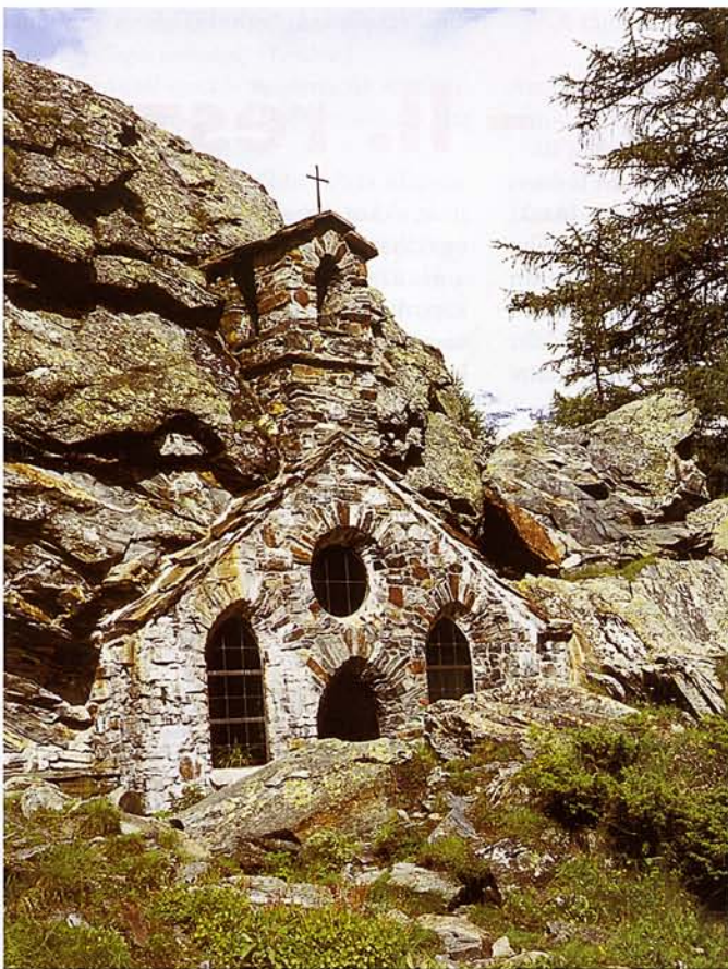
SZIKLAKÁPOLNA (MATREIER TAUERNHAUS FŐLÖTT)