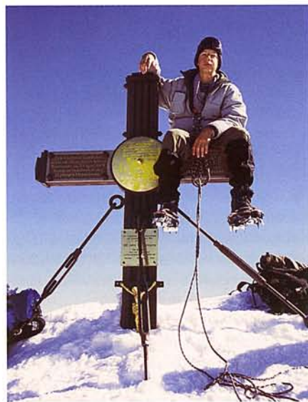
NÁNDOR A CSÚCSKERESZTEN

A túra alsó szakaszán gyorsan túljutottunk, de egyre nagyobb aggodalommal figyeltük a ködbe burkoló hegyet. 2200 méter felett mindent hó borított, és már a Neue Prager Hütte előtt fel kellett venni a kamáslit és a hágóvasat. A ház felé vezető ösvényen itt-ott még felsejlettek a régebbi lábnyomok, de gyakran beszakadt alattunk a hó, amibe egyszer derékig süllyedtem. A 2003-as igen meleg nyáron az Alpokban 3000 méter alatt alig láttunk havat, most pedig már a menedékház megközelítése is extrém túrának bizonyult.