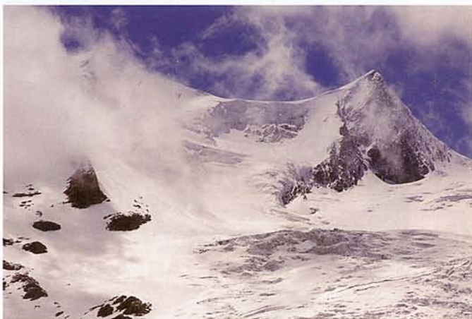
PILLANATNYI JÓ IDŐ A GROSSVENEDIGER KÖRNYÉKÉN