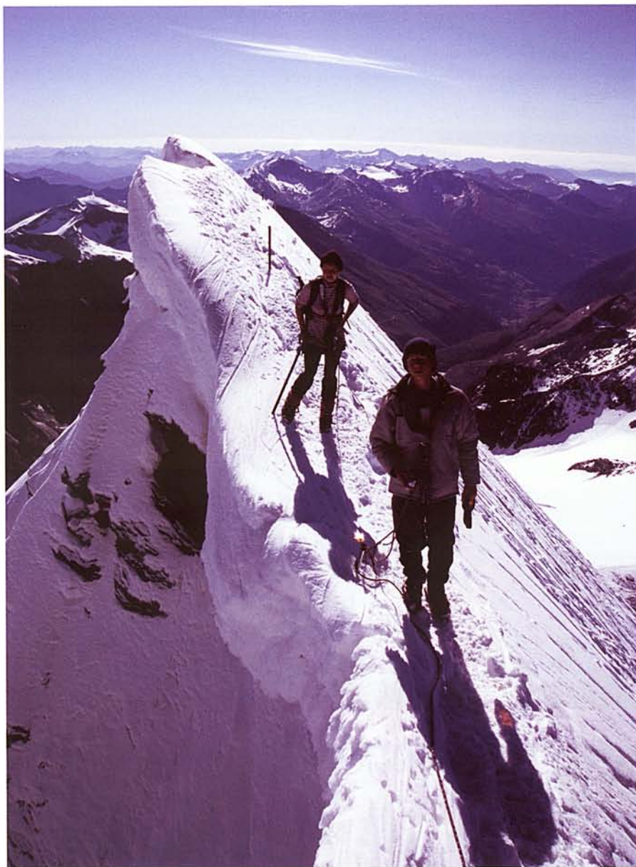
ÚTBAN A GROSSGLOCKNER FELÉ

R égen jártunk utoljára a Magas-Tauern hegyei között, ezért a távolabbi utak mellett egy kelet-tiroli kirándulást is beiktattunk nyári programunkba. Elsősorban a Grossglockner megmászását tűztük ki célul, de kezdő túratársunkra tekintettel a kisebb technikai nehézséget jelentő Grossvenedigert is tervbe vettük.