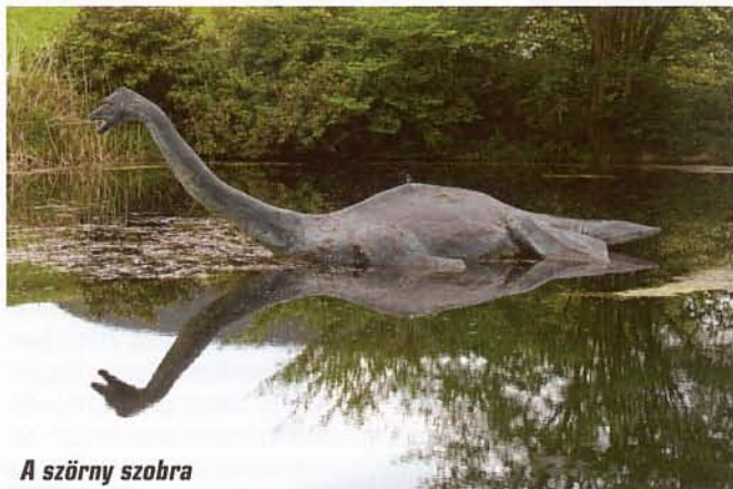
A szörny szobra