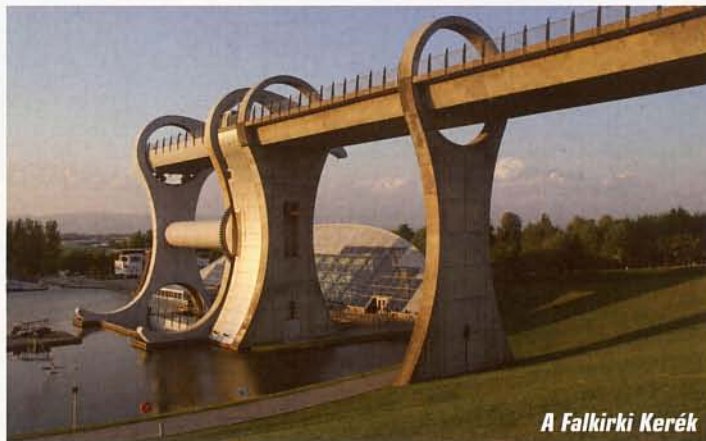
A Falkirki Kerék

vetlen közelében több száz méter mélységű, széles hópárkánnyal határolt szakadék zuhan alá. A szakadék szinte benyúlik az útvonalba, a csúcsjelzéshez csak annak megkerülése után érhetünk el. A feljutás ezúttal nem bizonyult kiemelkedő teljesítménynek, a korábbi próbálkozást tekintve azonban mégis megküzdöttünk érte. A megszokottnál is hosszabban időztünk a csúcson, ahol – melegrekord ide vagy oda – néhány fiatal inkább virtusból dobta le a pólóját. A legtöbb túrázó meleg ruházatban állt a kamerák elé.