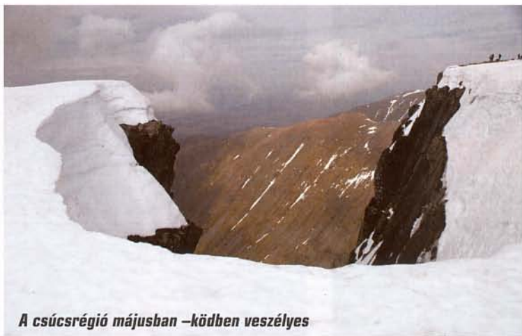
A csúcsrégió májusban –ködben veszélyes