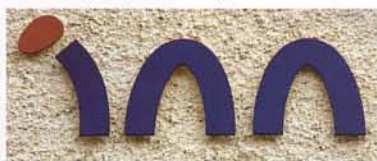
Fogadó Loch Ness mellett

A skót felföld kiemelkedő látványossága a Loch Ness, egy tó, amely nem szépsége vagy a közelében álló kastélyok és romok,