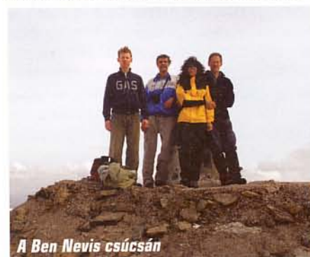
A Ben Nevis csúcán