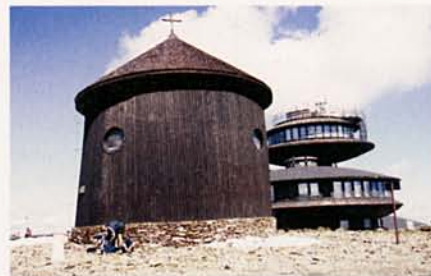
A „LEGSZEBB” ÉPÜLETEK A SNEZKA LENGYEL OLDALÁN

kezett a csúcsra. Csehország legnagyobb hegye, melyre elsőként már a 13. században feljutottak, az előképzettséggel nem rendelkező kirándulóknak is bátran ajánlható.