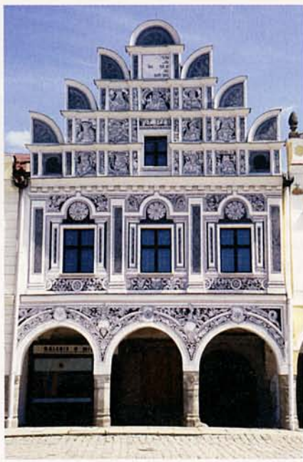
TELČ – AZ ÖTVENNYOLC LÁBASHÁZ EGYIKE

Útban az Óriáshegység felé csak egyetlen településen álltunk meg, innen azonban alig akartunk továbbmenni. Litomyšl elsősorban reneszansz kastélyáról híres, de érdemes besétálni az óváros főterére, vagy elidőzni a szobrokkal díszített parkokban. Már estele-