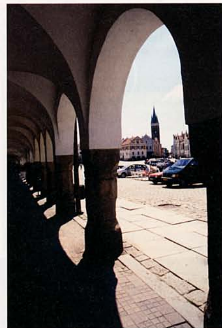
TELČ – LÁTKÉP A VÁROSHÁZA ÁRKÁDJA ALÓL

Visszafelé egy másik utat választottunk, ahol még a felfelé vezető ösvénynél is kényelmesebben tudtunk haladni. Az útvonal nehézségére utal, hogy olyan túrázóval is találkoztunk, aki hátán nagyböngővel igye-