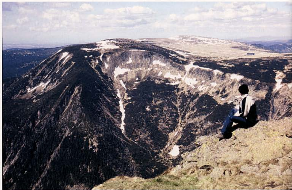
LÁTKÉP A SNEZKA CSÚCSÁRÓL

dezt, amikor a hegy lábánál kiszemelt kempingbe megérkeztünk.