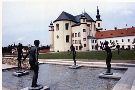
LITOMYŠL – PIARISTA TEMPLOM ÉS SZOBORPARK