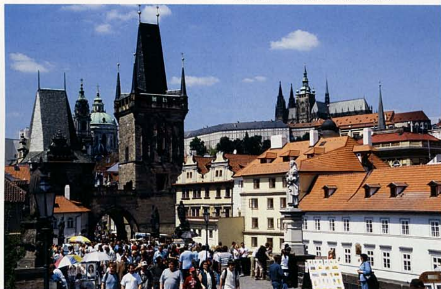
PRÁGA TORNyai A KÁROLY-HÍDRÓL

lostor, a templomok és az évszázados halastavak mellett a látnivalók közül a főteret övező ötvennyolc lábasházat kell kiemelni. Érdekes felkeresni a közelben fekvő Třebíčet is, a város értékei elsősorban a középkori zsidó negyed és az eredetileg román stílusú, később átalakított és kibővített Szent Prokop-bazilika.