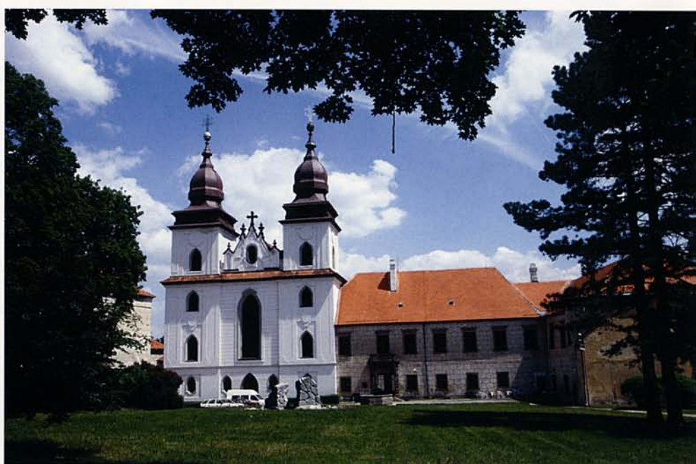
TŘEBÍČ – SZENT PROKOP-BAZILIKA

Útban hazafelé elsőként Telčben álltunk meg. A kisváros magja – a korábbi faházak helyén – a 16. század elején egy tűzvész követően alakult ki és a történelem viharai ellenére a mai napig meglepően egységes maradt. A vár, a volt jezsuita ko-