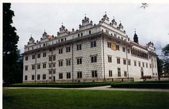
LITOMYŠL RENESSZÁNSZ KASTÉLYA