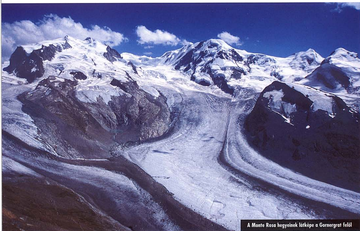
A Monte Rosa hegyeinek látképe a Gornergrat felől

H Az Alpok tíz legnagyobb csúcsából kilenc Svájcban található, csak éppen a listavezető Mont Blanc emelkedik a francia–olasz határon. A másodiknak és egyben Svájc legmagasabb csúcsának számító Dufour Spitze az országba látogató turisták előtt talán nem annyira ismert, mint a Matterhorn vagy a Jungfrau, de aki megfelelő tapasztalattal rendelkezik és a fáradságot