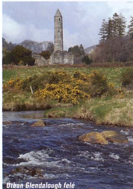
Útban Glendalough felé

Mielőtt a főváros környékét elhagytuk, felkerestük a Dublintól északra található ötezer éves építészeti emlékeket. A Boyne-folyó kanyarulatában álló megalit-építmények jóval korábban keletkeztek, mint a több fázisban készült dél-angliai Stonehenge, de a gízai piramisokat is 500 évvel előzik meg. A legnevezetesebb közü-