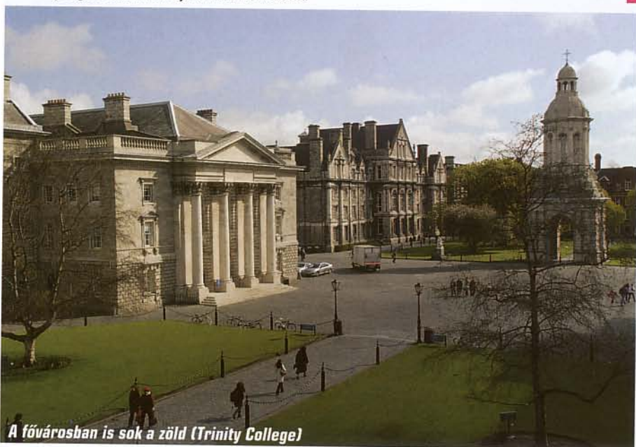
A fővárosban is sok a zöld (Trinity College)