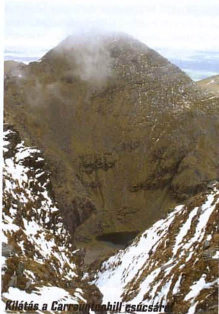
Kilátás a Carrauntoohill csúcsán

Bár Dublin méretét tekintve nem vetekedhet más európai fővárosokkal, almasnak semmiképp nem nevezhető. A nevezetességek és a sörözők felkeresése mellett mi is elidőztünk a tavaszi színpompába öltözött parkokban és végigsétáltunk a Liffey-folyó oldalára (töltésére) épített pallón, ahol sokan talán az év első napsugarainak örültek. Jó ötlet volt, hogy a zöld és virágzó sziget felkeresését tavaszra időzítettük.