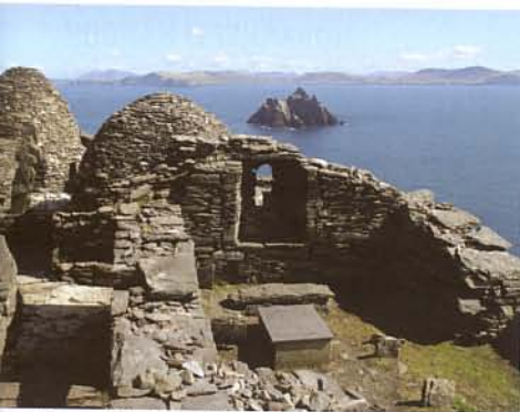
A madárvárta lát képe a Skelling Michael romjairól

még a havas szakaszon sem igényelt, Kékesről azonban szó sincs. A Carrauntoohill és az ezt magában foglaló – még nyelvtörőbb elnevezésű – Macgillycuddy's Reeks a kisebb magasság ellenére összképében a Magas-Tátrára vagy a Retyezátra emlékeztetheti a túrázókat.