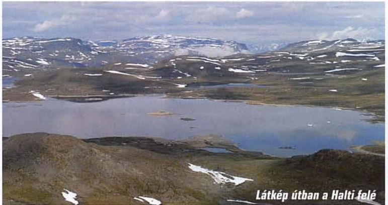
Látkép útban a Halti felé

gyobb dombcskákat láthattunk. A balra fekvő terület még Norvégiához tartozik, előttünk távolabb a legmagasabb önálló finn hegy, az 1316 méteres Ridnitsohka magasodott.