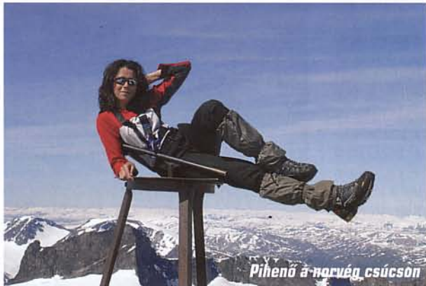
Pihenő a norvég csúcson