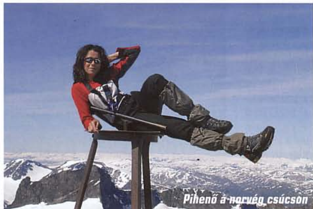
Pihenő a norvég csúcson