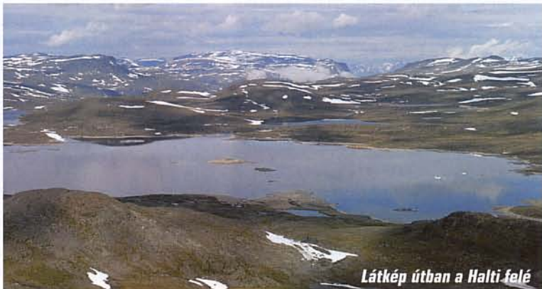
Látkép útban a Halti felé

gyobb dombocskákat láthattunk. A balra fekvő terület még Norvégiához tartozik, előttünk távolabb a legmagasabb önálló finn hegy, az 1316 méteres Ridnitsohka magasodott.