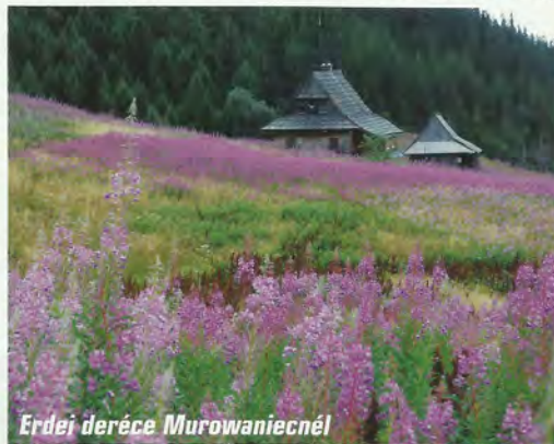
Erdei deréce Murowaniecnél

Utolsó lengyelországi napunkat már Zakopane-ban töltöttük. A természetet kedvelők nem mehetnek el szó nélkül a számos környezetbe illő, fából épült házikó mellett, amik a tátrai településnek különleges hangulatot kölcsönöznek. Ráadásul látogatásunk idején egy folklórtalálkozó is zajlott a városban, a népviseletbe öltözött csoportok a főútcán vonulva mutatták be országuk vagy tájegységük dalait és táncait. A hosszú túrákat követően, a hazaindulás előtt nem is vágytunk másra, mint egy ilyen relaxáló programra. Dziękuję bardzo, Zakopane! (Köszönjük, Zakopane.)