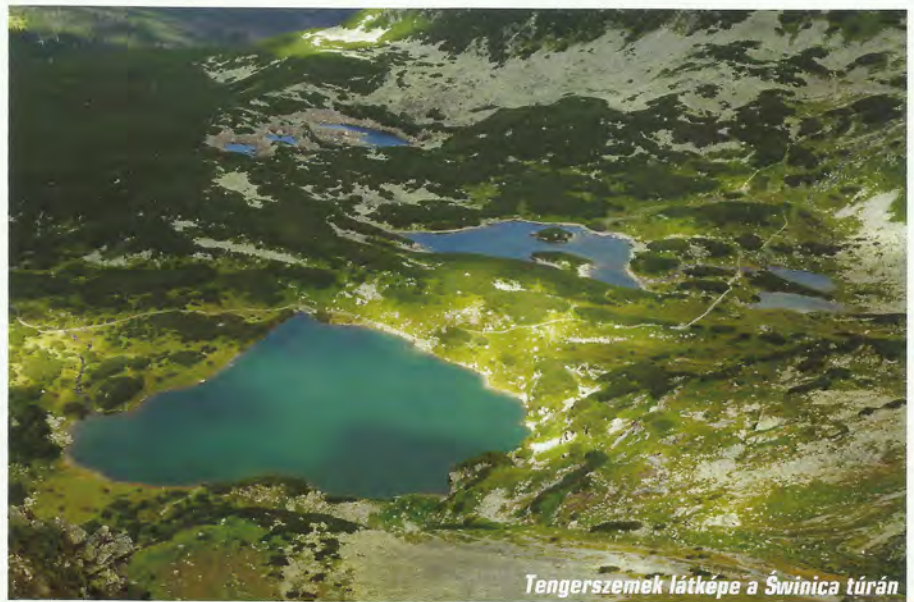
Tengerszemek látképe a Świnica túrán

És egy másik völgyön keresztül kapaszkodtunk vissza a gerincre. A Murowaniec felől a 2113 méteren található Kereszt-nyerget (Krzyżne) választottuk, de előbb itt is el kellett haladni egy színes tó, egészen pontosan a Vörös-tavacska (Czerwony Stawek) mellett. A túra alsó szakasza látványos, később