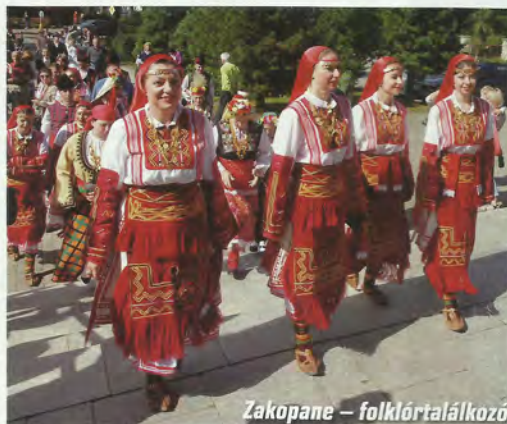
Zakopane – folklórtalálkozó