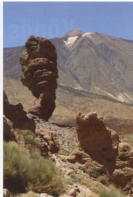
A Teide a Los Roques felől

hagyva maga mögött. Ilyen mechanizmussal tekintélyes méterű csövek jöhetnek létre, erre Tenerifé mellett a Kanári-szigetek más tagjaiban, El Hierro és Lanzarotén is találunk példát. Legkiemelkedőbb közülük az észak-tenerifei Icod közelében fekvő Cueva del Viento (Szelek-barlangja), melynek a Cueva del Sobradóval alkotott rendszere 18 kilométeres hosszúságával a Föld második leghosszabb lávabarlangja. Botanikailag nem érdemes, a világelső Kazumura Cave (Hawaii) 65 kilométeres hosszát nehéz lenne túlszárnyalni. Hírnév ide, hírnév oda, a barlang bejáratára sok kérdezősködés után végül egy gaztenger közepén találtunk rá. A leszakított, rozsdás vasajtón belépve kétirányú járatban találtuk magunkat. Úgy tűnt, a bal oldali a főág, ami szabályos, felül gömbölyű, testmagasságban kissé szűkülő formájú alagutat jelentett. Térképet nem vittünk, de az ilyen barlangokban