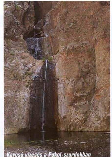
Karcshú vízesés a Pokol-szurdokban

nemzeti parkban, és minden nap új területet fedeztünk fel. A térség legérdekesebb alakzatai a Las Lajas táborhely felől közelíthetők meg. A látványos formák elnevezéséhez túl nagy fantáziára nem volt szükség, a Sombrero-hegy tényleg az ismert kalapot juttatja eszünkbe, a Zapato de la Reina (Királynő cipője) pedig valóban egy túlméretes női lábbelihez hasonlít. A legtöbben a Los Roques szikláinál állnak meg. Az időjárással dacoló kemény vulkanikus alakzatok közül a Roque Cinchado (Abroncsos-szikla) a legismertebb, képe régi spanyol pezetán is szerepelt. Ha pedig a kiépített lépcsőkön a kövekre kapaszkodunk, a völgyben egy templom formájú vulkáni torony tűnik szemünkbe, amelyet megjelenéséről Ka-