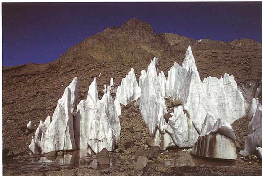
„VEZEKLŐK” A PLAZA DE MULAS TÁBOR MELLETT

évé vált, egyúttal kiemeli a geológiai képződmény monumentalitását is.