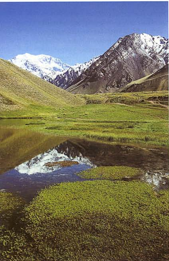
ALULRÓL FELTÖRŐ VÍZ TÁPLÁLTA TÓ AZ ANDOKBAN

Bécs és Madrid érintésével előbb Chile fővárosába, Santiago-ba repültünk, majd innen másnap autóbusszal indultunk tovább az argentin Mendoza-ba, ahol a mászási engedélyen kívül az élelmiszert és a gázpalackokat kívántuk beszerezni. Annak ellenére, hogy érkezésünk vasárnapra esett, sikerült mindent elintézni, így a következő napon elindultunk a túra kiinduló pontját képező Puente del Inca nevű piciny településre. A helység látványossága, mint neve is mutatja, egy természetes „Inka híd”, amely az utóvulkáni termálfelvezők ásványkiválásából képződött. A gyógyhatású, 34–36 Celsius fokos víz hasznosítására 1925-ben luxusszállót építettek, amit azonban 40 év elmúltával egy hatalmas lavina valósággal letarolt. Az épület romja azóta a tájkép rész-