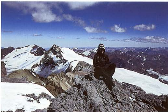
AKKLIMATIZÁCIÓ 5500 MÉTEREN