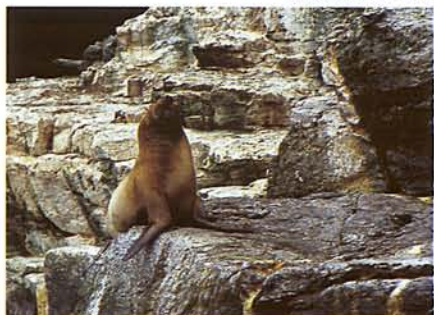
OROSZLÁNFÓKA A CHOROS-SZIGETEN