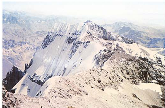
AZ ACONCAGUA DÉLI FALÁNAK LÁTKÉPE

kező napon foglalkoztam, pedig a gleccserláb és a szublimáció után visszamaradt jégoszlopok, a „vezeklők” látványa azonnal megragadott.