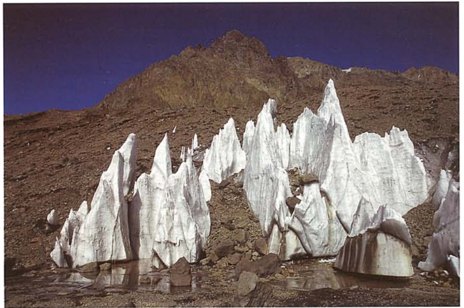
„VEZEKLŐK” A PLAZA DE MULAS TÁBOR MELLETT

Bécs és Madrid érintésével előbb Chile fővárosába, Santiago-ba repültünk, majd innen másnap autóbusszal indultunk tovább az argentin Mendoza-ba, ahol a mászási engedélyen kívül az élelmiszert és a gázpalackokat kívántuk beszerezni. Annak ellenére, hogy érkezésünk vasárnapra esett, sikerült mindent elintézni, így a következő napon elindultunk a túra kiinduló pontját képező Puente del Inca nevű piciny településre. A helység látványossága, mint neve is mutatja, egy természetes „Inka híd”, amely az utóvulkáni termálfelvezők ásványkiválásából képződött. A gyógyhatású, 34–36 Celsius fokos víz hasznosítására 1925-ben luxusszállót építettek, amit azonban 40 év elmúltával egy hatalmas lavina valósággal letarolt. Az épület romja azóta a tájkép rész-