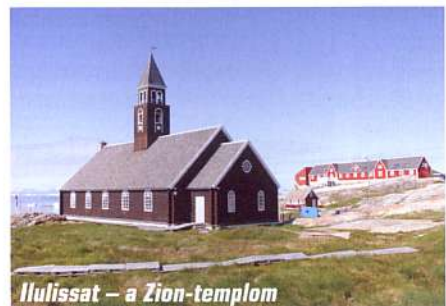
Ilulissat – a Zion-templom

A múlt nagy felfedezőin túl tanulhat-e a mai európai utazó még bármit is Grönland őslakóitól? Utazásunk végén úgy láttuk, hogy az együttműködést és a toleranciát egészen biztosan. ■