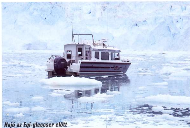
Hajó az Eqi-gleccser előtt

Nyaranta a gleccser rendszeresen „borjadzik”, azaz jégtömbök válnak le róla, amik nagy robajjal zuhannak az öböl vizébe. A borjadzás természetes folyamat, a problémát az jelenti, hogy a téli időszakban kevesebb jég képződik annál, mint amennyi nyáron a tengerbe olvad. Az elmúlt évtizedekben átlagosan évi 140 gigatonna jég tűnt el Grönland gleccsereiből. Mindez jelenleg kevesebb, mint egy milliméterrel emeli az óceánok szintjét évente, a folyamat azonban felgyorsulhat. Amennyiben Grönland teljes jégtakarója elolvadna, a világtengerek szintje 7 méterrel emelkedne meg.