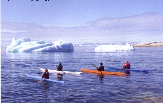
Kajakozók a jéghegyek előtt

Másnap a piros jelzés felől indulva visszatértünk a tengerparti kék szakaszra, mégis teljesen más jégszobrokat találtunk itt, mint az előző nap során. Az áramlás az egyik jégtömböt