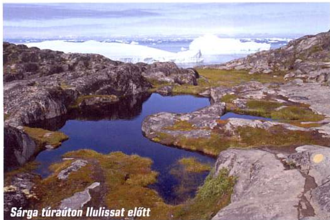
Sárga túraúton Ilulissat előtt

Az inuit nyelv néhány szava – így az iglu, az anorák vagy a parka – mára más nyelvekbe is bekerült, a legismertebb eszkimó kifejezés azonban kétségtelenül a kajak – a grönlandi nyelvben qajaq. Érdekes, hogy a tradicionális vízhatlan ruha, a tuilik neve nem terjedt el, pedig eredetileg ennek viselése tette lehetővé a jeges vízben végrehajtott eszkimófordulót.