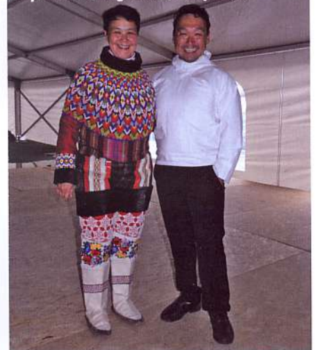
Népviselet a rögtönzött színpadon

ként. A népviseletbe öltözött helyiek itt mutatták be zenéjüket, táncukat, majd készséggel álltak mintás ruháikban kameráink elé.