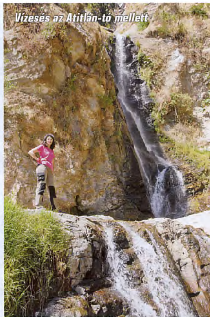
Vízesés az Atitlán-tó mellett

Négy órával indulásunkat követően vékony fémoszlopot vettünk észre, a magasságmérő pedig pontosan 4220 métert mutatott. Elértük