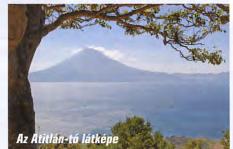
Az Atitlán-tó látkepe