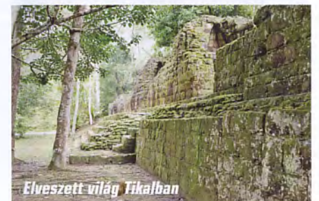
Elveszett világ Tikalban