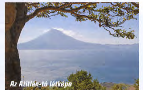
Az Atitlán-tó látkepe