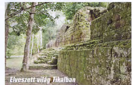
Elveszett világ Tikalban