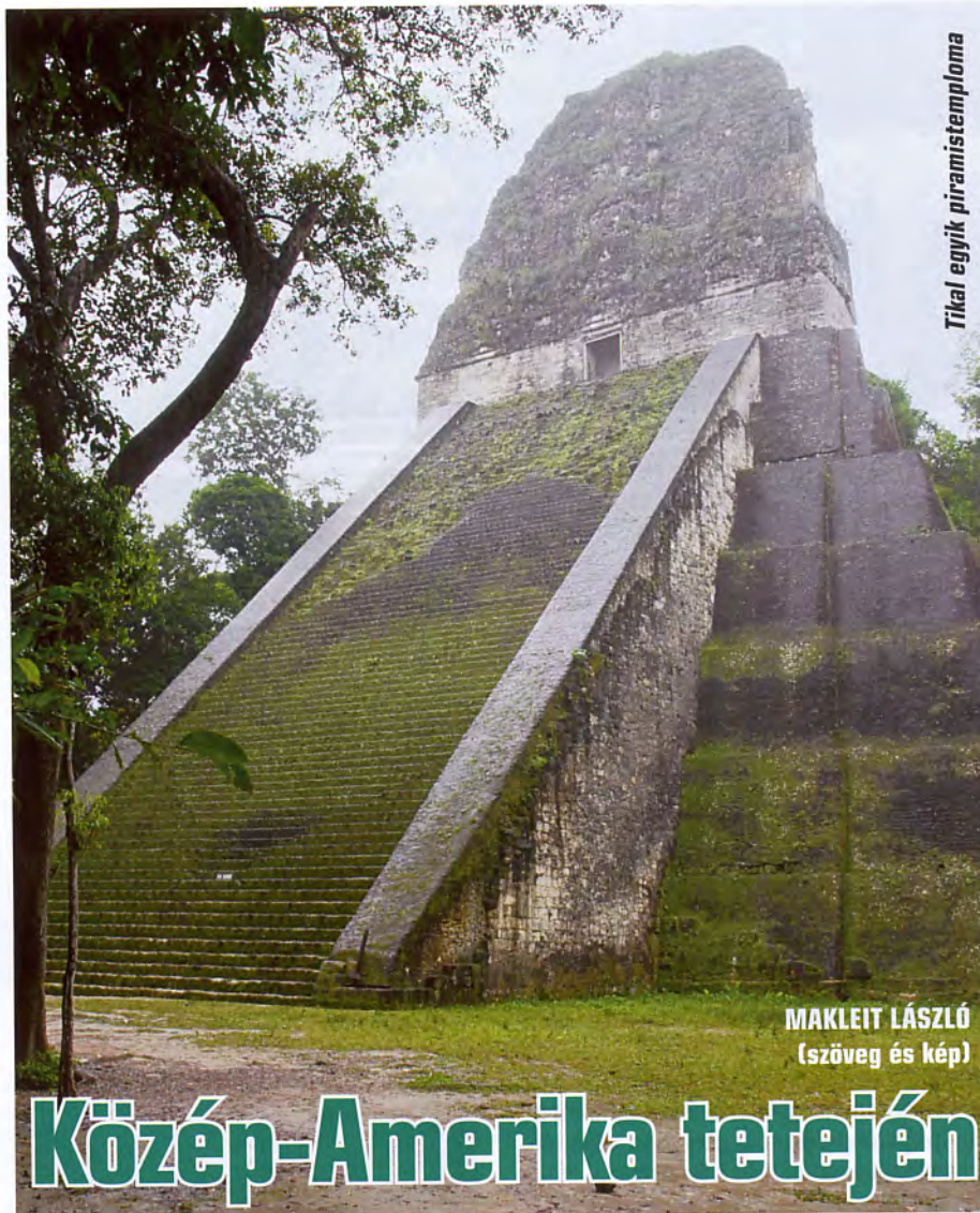
Tikal egyik piramistemploma