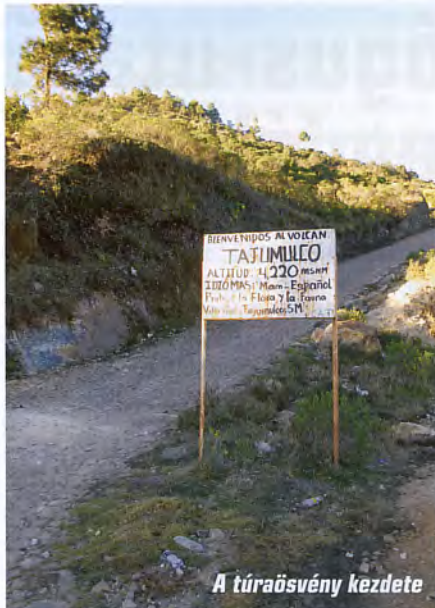
A túraösvény kezdete

A Maja Birodalom, számos más kultúrához hasonlóan egy történelmi klímaváltozás áldozatául esett. Később a hódítók építkezéseit a geológiaiailag aktív területeken – mint korábban utaltunk rá – a vulkánok és földrengések pusztították el. Vajon tanultunk-e mindezekből?