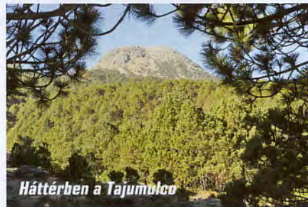
Háttérben a Tajumulco

Guatemala legmagasabb pontját, mely egyben Közép-Amerika tetejét is jelenti. Az időjárás kegyes volt hozzánk, rossz időben, pontos GPS-adatok nélkül bizonyára nagyobb kihívást jelentett volna a célpont lokalizálása. Felfelé csak egyetlen kis csapattal talákoztunk, melyet két túrázó és egy „guide” alkotott, akik elképedve konstatálták, hogy vezető nélkül igyekszünk a csúcsra.