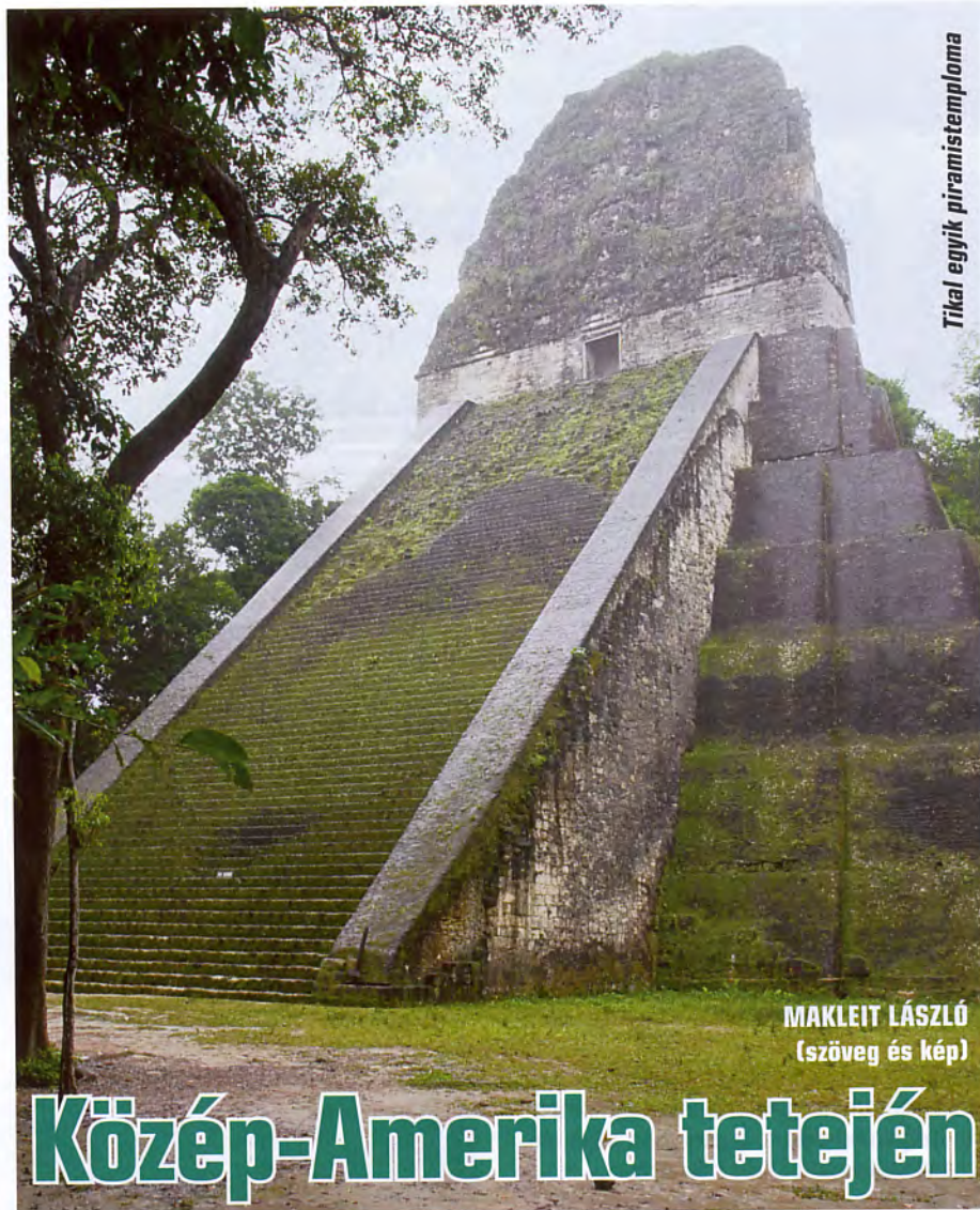
Tikal egyik piramistemploma