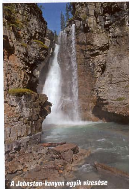
A Johnston-kanyon egyik vízesése

Alig léptünk a következő nemzeti park, a Banff területére, egészen pontosan annak névadó városában jártunk, amikor egy házikó előtt, a virágágyásban békésen legelésző vapitit vetünk észre. A lakók előbb kiabálással próbálták