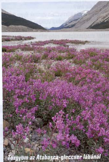
Tűzgyom az Atabasca-gleccser lábánál

majd a szokásos teendők és bevásárlás végetével meg sem álltunk a Yoho Nemzeti Parkig. Bemelegítő túrának az Emerald-tó és a Hamilton-tó közötti útvonalat választottuk, a hasonló nevű vízesés érintésével. Az Emerald-tó önálló programként két óra alatt sétálha-