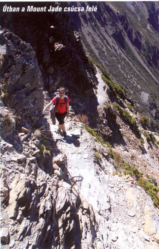
Útban a Mount Jade csúcsa felé

A sziget északkeleti részén találjuk a Taroko Nemzeti Parkot. A gyors folyók, valamint az értékes kőzetek miatt korábban itt vízerózió építése és márványbánya nyitása merült fel, de szerencsére végül a természetvédelem győzött. Taroko légvonalban nincs messze a csúcsmászás során felkeresett Alishantól, a sziget közepén azonban magas hegylánc fut végig, ami a közlekedést rendkívül meglassítja. Éppúgy, mint Yeliu esetén, Taroko felkeresésére is a legegyszerűbb a főváros, Tajpej felől indulni. Ismét korán csörgött tehát a vekker, így a hegyi folyók, vízesések, hatalmas körgöttek és simára csiszolt falak között három szűrrára is jutott időnk.