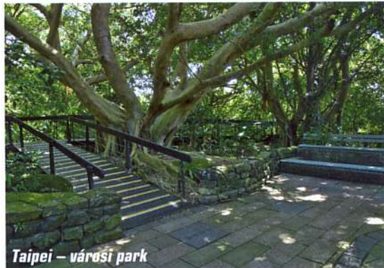
Taipei – városi park

A nyomtatott példányra mindenképpen szükség van, mert a park bejáratánál erre kapjuk azt a bűvös pecsétet, ami végül megnyitja a hegymászóösvény kapuját. Ehhez az adminisztrációhoz