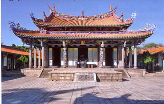
Tajpej – a Konfuciusz-templom

Árnyékre ugyan sok szükség nem volt, mert a reggeli napsütést délutánonként felhősödés és rövid zápor követte. Tajvan klímája meglehetősen nedves, a havi esőnapok száma egyedül októberben és novemberben marad tíz alatt. A túrák szervezésénél ezt figyelembe kell venni, a gazdag vegetáció látványa azonban mindenért kárpótlást nyújt.