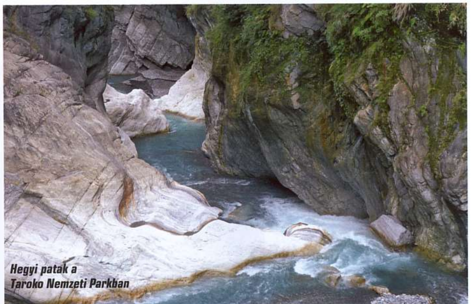
Hegyi patak a Taroko Nemzeti Parkban

Persze fel kellett tölteni olyan fotót, mellyel bizonyítjuk, hogy jártunk már háromezer méternél magasabb csúcson, és igazolni kellett a magashegyi biztosítás meglétét. A felületen még egy tesztvizsgához kötött hegymászó gyorstalpalót is el kellett volna végezni, de ezt végül sikerült kikerülni.