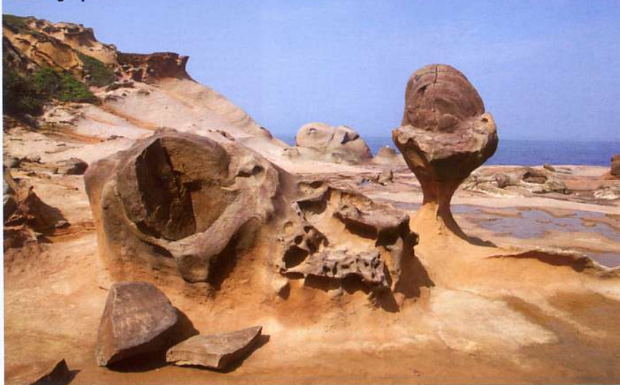
Yeliu – geopark