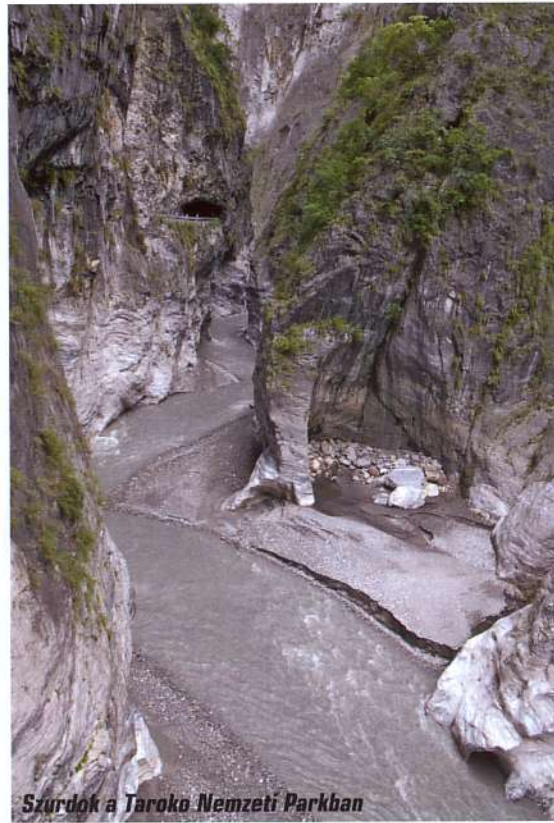
Szurdok a Taroko Nemzeti Parkban

Tajpej látványosságainak részletezése meghaladná az összeállítás kereteit, a város természeti látivalóiról azonban szót kell ejteni. Tajvan Japánhoz hasonlóan a Cirkumpacifikus-hegységrendszer, ismertebb nevén a Tűzgyűrű része. A szigeten gyakoriak a földrengések, és a vulkánosságnak is tanúi lehetünk. Utolsó túranapunkon mi is felkerestük a főváros északi részén fekvő Yangmingshan Nemzeti Parkot, ahol meleg vízű forrásokat, fumarolákat és kénkiválásokat is megfigyelhetünk.