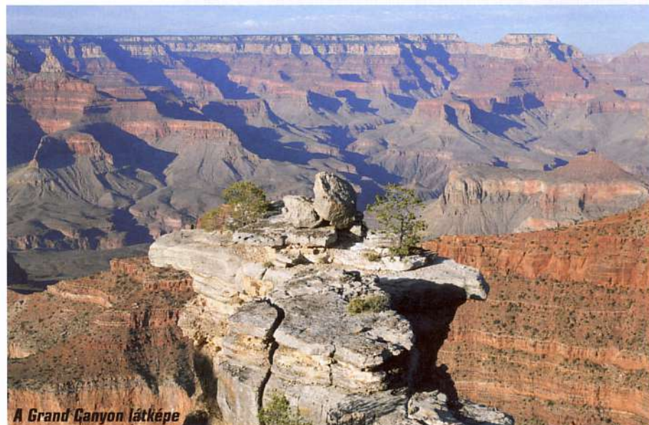
A Grand Canyon látképe

Közel egy órát töltöttünk a Colorado partján, ahová időközben egy raftingos csapat is megérkezett. Sietni nem kellett, az ötórásra tervezett