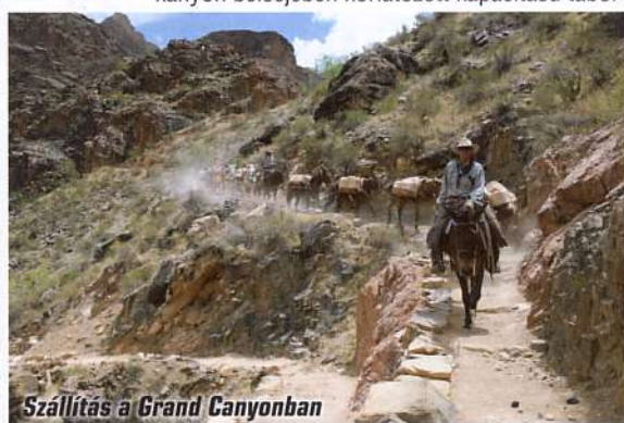
Szállítás a Grand Canyonban

három park felkeresése esetén megtérül. A kártya ráadásul egy alkalommal átruházható, tehát ha ismerősünk tervez hasonló utazást, teljesen legálisan használhatja a belépőnket. A törzsi területekre a kártya nem érvényes.