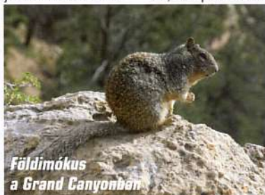
Földimókus a Grand Canyonban

Mielőtt az első nemzeti parkot felkeressük, érdemes beszerezni az „America the Beautiful” nevű plasztikkártyát. Ez lényegében egy belépő, ami egy éven keresztül az ország valamennyi állami kezelésű parkjába érvényes, az ára pedig olyan kedvező, hogy már