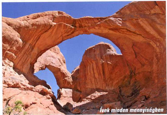
Ívek minden mennyiségben