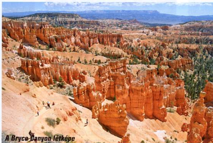
A Bryce Canyon létképe

Sajnos a jellegzetes sziklák és zuhatagok mellett nem találtunk semmilyen jelölést, elnevezést. Eltévedni persze lehetetlen, a szűkületben azonban a navigáció sem működött, ezért csak találgattuk, pontosan merre járunk.