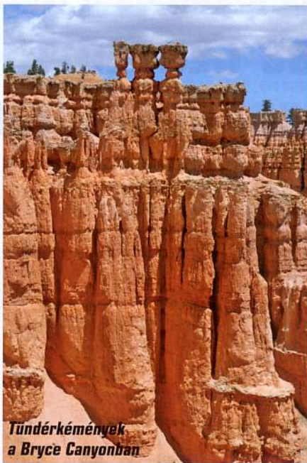
Tündérekémények a Bryce Canyonban

A Zion Nemzeti Park leglátványosabb része a Narrows (Szűkület). Az elnevezés azonban nem csak a túraösvényre, hanem az idáig vezető aszfaltozott útra is igaz. Hagyjuk a gépkocsikat a kijelölt parkolóban, és haladjunk tovább az ingajáratban közlekedő ingyenes autóbusszal. A gyalogösvény egy darabon egy folyócska, a North Fork Virgin River partján halad, majd a vízben folytatódik. A hatalmas sziklafalak árnyékában, a bokáig-térdig érő folyóban akár órákon át túrázhatunk, amennyiben felkészültünk a jéghideg vízben történő gyaloglásra.