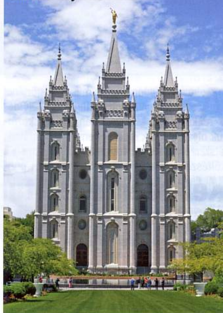
Salt Lake City katedrálisa

Mielőtt Utah államtól is búcsút vettünk volna, ellátogattunk a fővárosba, a Nagy Sóstó szomszédságában fekvő Salt Lake City-be. A nemzeti parkokat ismertető összeállításban nem kívánom hosszan taglálni a város nevezetességeit, de annyit meg kell állapítani, hogy az utunk során felkeresett települések között igazi gyöngyszemnek számít. Magaslati fekvésének köszönhetően kiváló a klímája, a kormányzati központ (Utah State Capitol) előtti térről a várost szegélyező hőfötte hegycsúcsokra látni.