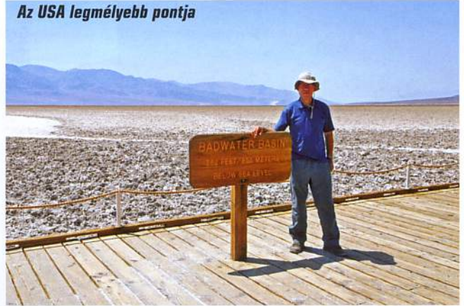
Az USA legmélyebb pontja

és egy F/A-18-as vadászgép gyakorló repülésre épp beszállt a szurdokba. Nem mindennapi élmény, érdemes rákeresni és megnézni valamelyik amatőr felvételt az interneten.