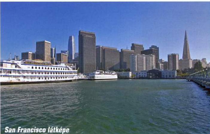
San Francisco látképe

A Death Valley emblematikus helyszíne a Zabriskie Point. A térségben egykor bóraxot bányásztak, Christian Brevoort Zabriskie a bányatársaság igazgatója volt. Róla nevezték el a megkövesedett tófenékre néző kilátópontot. A különleges helyszínt nem a park reklámkampánya, hanem Antonioni hasonló című filmje tette világszerte ismertté. Ezzel a túrával lassan bezártuk a kört, és az ország egyik legkopárabb térségéből az egyik legpezsgőbb városba indultunk, Las Vegasba.