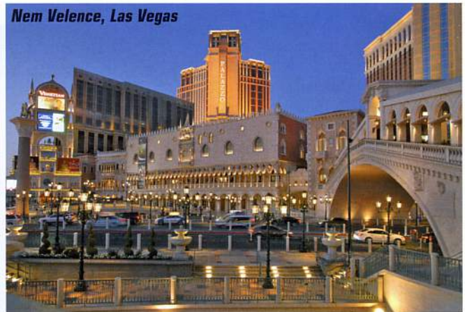
Nem Velence, Las Vegas