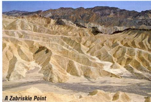
A Zabriskie Point

A kisebb erdőtüzek nem ártalmasak, sőt szükségesegek az egészséges mamutfenyő-állomány kifejlődéséhez. A tűz az élősködőket elpusztítja, megtisztítja a talajt az aljnövényzettől, a hamu ásványi anyagai pedig az első esőzéssel a talajba jutnak. A fiatal mamutfenyőknek elegendő mennyiségű fény és tápanyag szükséges, a növekedéshez. Nem véletlen, hogy a tobozok csak igen magas hőmérsékleten nyílnak ki annyira, hogy a magok ki tudjanak pattanni belőle. A Kings Canyonban még látogatásunk idején is parázsolt a túraút melletti erdő. Tábla hívta fel a