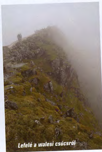
Lefelé a walesi csúcsról

Az északír főváros, Belfast felkeresése után komppal előbb Skóciába hajóztunk, majd a Római Birodalom egykori határát képező limes, Hadrianus falának vonalát keresztezve megérkeztünk az Angol-tóvidékre. Szállást a festői