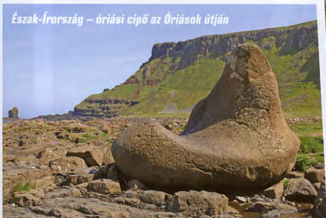
Észak-Írország – óriási cipő az Óriások útján