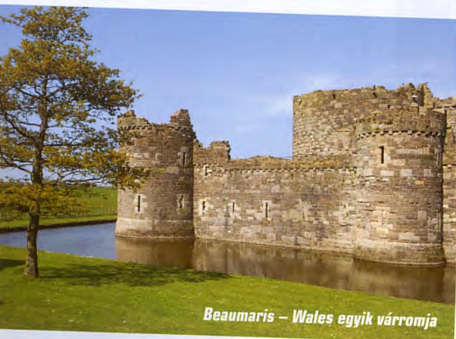
Beaumaris – Wales egyik váromja

Walesből előbb Dublinba, majd a Temple Bar felkeresése után Észak-Írországra indultunk tovább. Útközben azt találgattuk, mikor léphettünk újra az Egyesült Királyság területére, mert csak annyit vettünk észre, hogy mások lettek a rendszámok, egy közlekedési tábla pedig arra figyelmeztetett, hogy a távolságok újra mérföldben