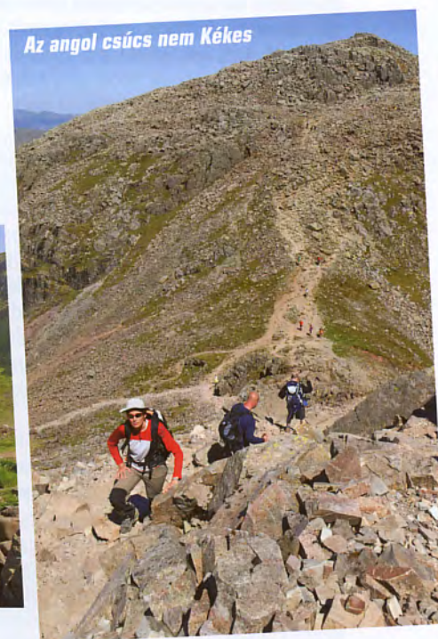
Az angol csúcs nem Kékes