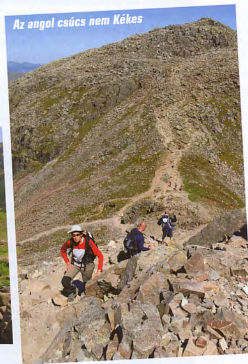
Az angol csúcs nem Kékes