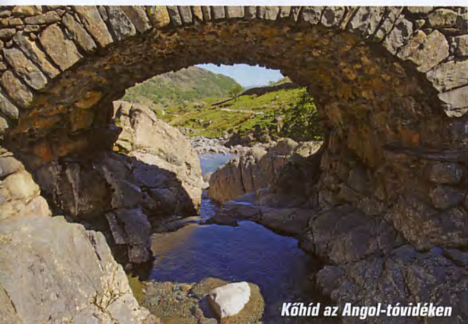
Kőhíd az Angol-tóvidéken

és nem kilométerben értendők. A mindössze 853 méteres Slieve Donard, Észak-Írország legmagasabb pontja Newcastle (egyik a sok közül) szomszédságában emelkedik. Vélhetően ebből a könnyűnek tűnő csúcsból az elindulás előtt nem készültem fel eléggé, mert a túra első méterein csak ámultam, majd társaimat „rohánok vissza az állványért” megjegyzés kíséretében hamarosan faképnél hagytam. A pataknyi szélességű Glen River hol sebes rohanásával, hol változatos alakú és méretű zúgóival kínált