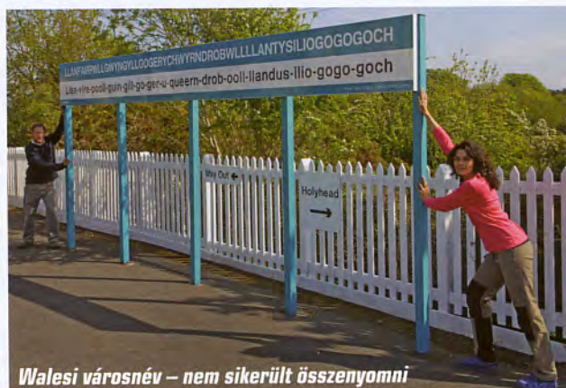
Walesi városnév – nem sikerült összenyomni