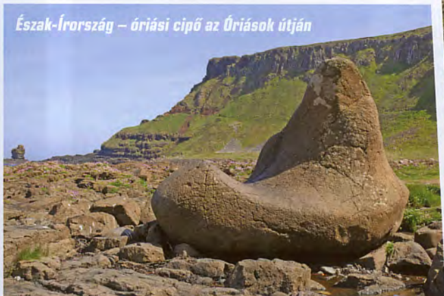
Észak-Írország – óriási cipő az Óriások útján