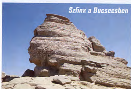
Szfinx a Bucsecsben

Utunk innen lényegesen egyszerűbbé vált, előbb omladékos ösvényen, majd egyre szélesebb úton jutottunk vissza a hegy lábához, ahol egy tehénitatónál kiszáradt kulacsunkat is újra tudtuk tölteni. Megrémülni nem kell, a vályúba egy hús forrás vizét vezették. Már szürkült, amikor a Macska-szoros, majd a Zernyesti-szoros sziklafalai közé értünk. Innen, ha nem is nyílegyenes, de sima sétaút vezet a parkolóig, ahová több mint 13 óra elteltével értünk vissza.