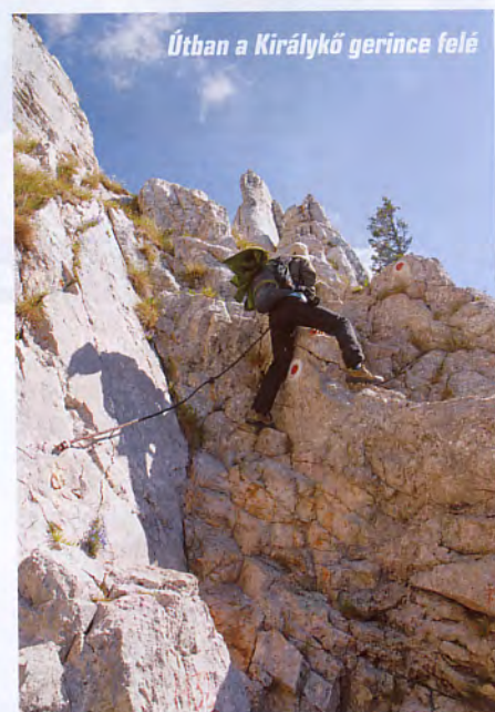
Útban a Királykő gerince felé