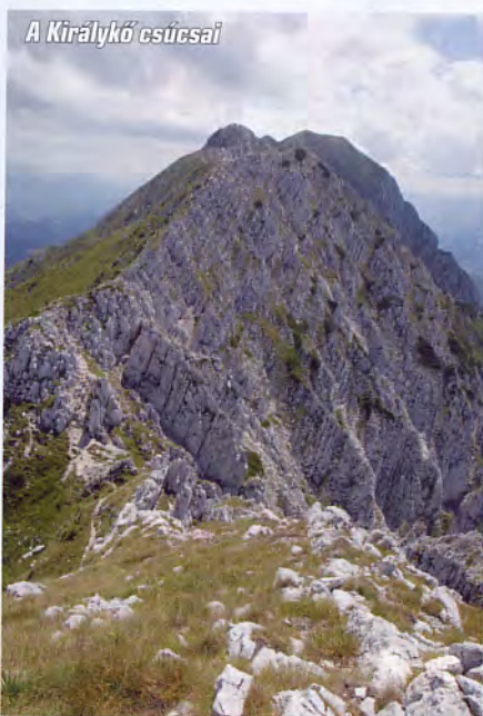
A Királykő csúcsai

Az útvonal a legtöbb kiemelkedésre felkanyarodik, néhány esetben azok alatt vezet. A Pásztor-csúcsához közeledve vélhetően kevés túrázó vállalkozik egy újabb kitérőre, innen kapta nevét a 2202 méteres Félreeső-Völgykatlan-