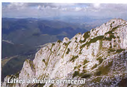
Látkép a Királykő gerincéről

Az útvonal természetesen ellenkező irányban is teljesíthető, ennek azonban határozott hátrányai vannak. A szorosokon átvezető hosszú gyaloglást követően a „beszállás” nehezebben azonosítható, ami idővesztést jelenthet. A gerinctúra végén, fáradtan, drótköteles szakaszon kell visszaereszkedni a menedékházhoz – és persze az sem mindegy, hol estelődik rá a túrázókra.