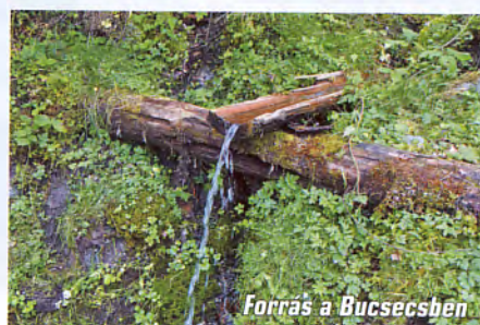
Forrás a Bucsecsben

További túranapjaink során a Királykő és a Bucsecs több más útvonalát is bejártuk, az első alkalommal szűrületben felkeresett Zernyesti-szorosban pedig még fotótúrát is tettünk, legérdekesebbek mégis a hegységek legmagasabb csúcsaira vezető útjaink voltak. A lenyűgöző tájhoz mintaszerűen festett jelzések és az Alpokban megszokott információs táblák társulnak. A útvonalak túraidejét olvasva ne legyünk nagyképeűek, elég néhány fotózással töltött perc vagy rövid szusszanó, és semmit sem tudunk ráverni a megadott időkre.