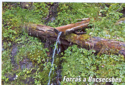
Forrás a Bucsecsben

További túranapjaink során a Királykő és a Bucsecs több más útvonalát is bejártuk, az első alkalommal szűrületben felkeresett Zernyesti-szorosban pedig még fotótúrát is tettünk, legérdekesebbek mégis a hegységek legmagasabb csúcsaira vezető útjaink voltak. A lenyűgöző tájhoz mintaszerűen festett jelzések és az Alpokban megszokott információs táblák társulnak. A útvonalak túraidejét olvasva ne legyünk nagyképeűek, elég néhány fotózással töltött perc vagy rövid szusszanó, és semmit sem tudunk ráverni a megadott időkre.