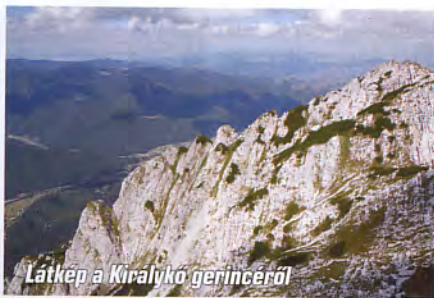
Látkép a Királykő gerincéről

Az útvonal természetesen ellenkező irányban is teljesíthető, ennek azonban határozott hátrányai vannak. A szorosokon átvezető hosszú gyaloglást követően a „beszállás” nehezebben azonosítható, ami idővesztést jelenthet. A gerinctúra végén, fáradtan, drótköteles szakaszon kell visszaereszkedni a menedékházhoz – és persze az sem mindegy, hol estelődik rá a túrázókra.