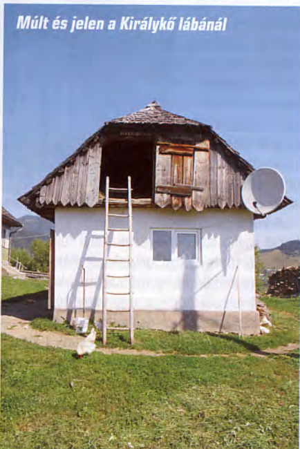
Múlt és jelen a Királykő lábánál

Másnap ilyen hosszú túrát nem terveztünk, ezért a Bucsecs-hegység sziklaalakzatait vetjük célba, amik felvonóval is megközelíthetők. Láthatóan sokan gondolkodtak hasonlókép-