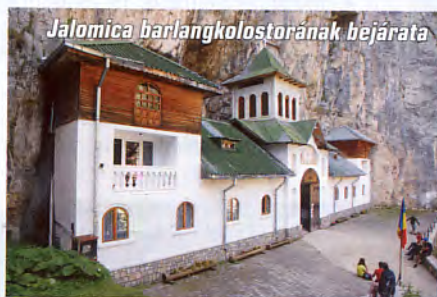
Jalomica barlangkolostorának bejárata

pen, mert a borsos jegyár ellenére több mint két órás várakozást követően léphettünk a Busteni felől induló zsúfolt kabinba. Hamar kiderítettük, hogy a hegység több más módon is megközelíthető – kevésbé embertelen körülmények között és sokkal olcsóbban. A felvonóház mellett ajánlkozó terepjárós vállalkozók szolgáltatása a sorállásnál kedvezőbb alternatívát jelent. Ennél is jobb, ha a teljes