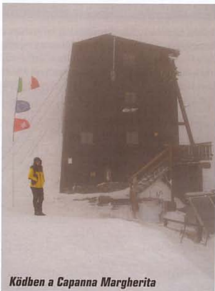
Ködben a Capanna Margherita

A völgy végén emelkedő Colle de Lys dombocskája jelentette a ködzóna határát, itt elköszöntünk újdonsült társainktól, majd fotózást követően elindultunk a veszélytelennek látszó terepen. A havazást követően azonban a gleccser további szakasza is tartogathat meglepetéseket. A hasadékokat a friss hóréteg elfedi. Elég egy rossz lépés, és örülhetünk, ha csak nyakig zuhanunk az ismeretlenbe. A Monte Rosa alaposan rászolgál nevére, az elnevezés második tagja ugyanis nem a hegység színére utal, hanem a „rouese” kifejezésből származik. A szó jelentése a térségben használt frankoprovanszál nyelvjárásban nem más, mint gleccser.