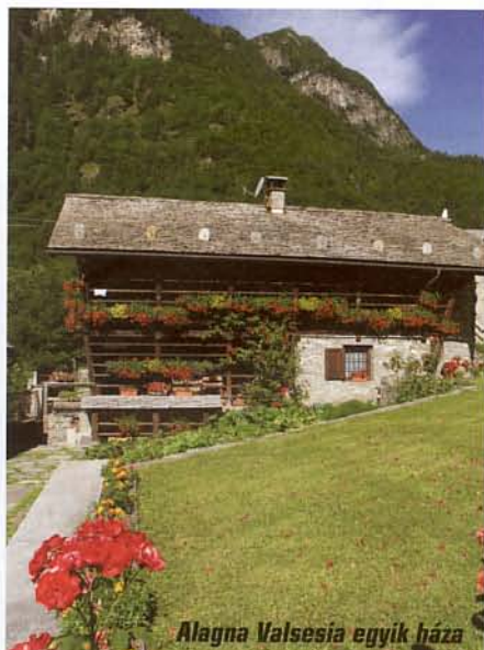
Alagna Valsesia egyik háza