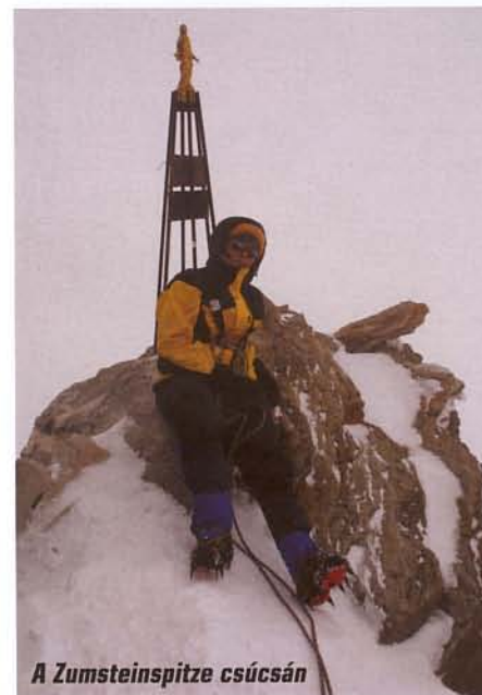
A Zumsteinspitze csúcsán