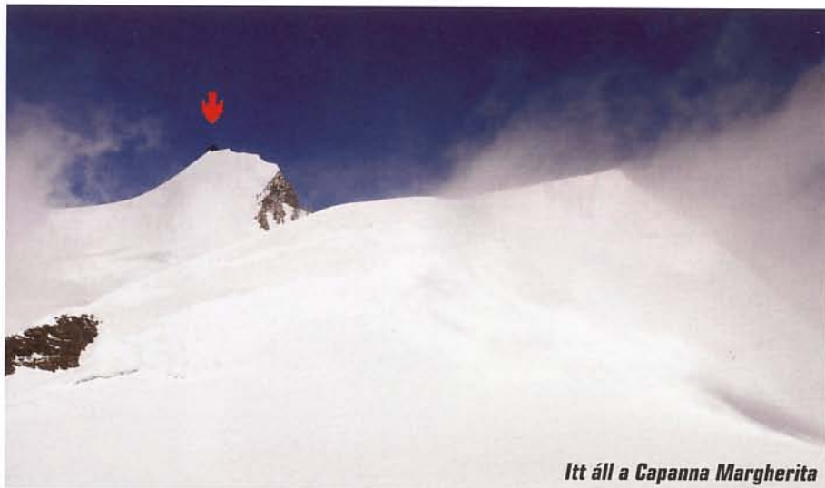
Itt áll a Capanna Margherita

lapos tetejére. Sok parti mozgott a környéken, a heves szélrohamok miatt azonban nagyon kevés időt töltöttek a hegytetőkön. Fotózáshoz nem volt kit megkérni, így egymásról készítettük el az emlékképeket, és tovább indultunk a Balmenhorn irányába. A 4167 méteres kiemelkedés nem számít független csúcshoz, a tetején épült biva-kház melege azonban vonzóbbnak bizonyult, mint a négyezresek vadászata. Reggelizés és hágóvasszerelés után újult erővel indultunk az említett, kettős nevű Corno Nero irányába. A picit, de meredek jégfal igényelte hat csúcsból álló mászóprogramunk során a legnagyobb odafigyelést. A csapatok jó része kihagyta, akik pedig nekivágtak, fix köteleket építettek a lejtő aljáig. Alpesi stílusban csak kevesen vállalták a feljutást.