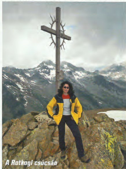
A Rotkoglj csúcsán

Mintha restelltük volna, hogy az első nap nem másztunk csúcsot, következő túranapunkon mindjárt kettőt is beiktattunk a programba. A Giggijoch, majd a Rotkogljoch nyeregből először a Schwarzkogel 3016 méteres csúcsára kapaszkodtunk fel, majd a Fekete-tó mellett elhalad-