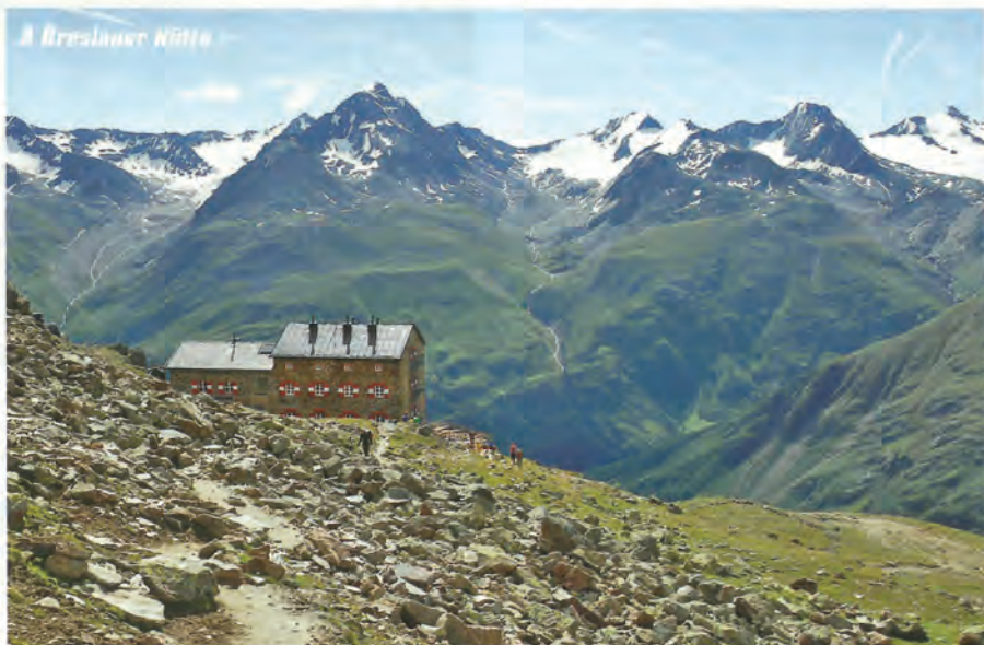
A Bleslauer Hütte