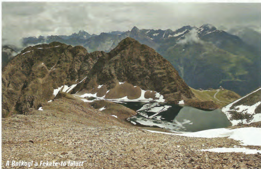
A Rotkoglj a Fekete-tó fölött