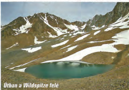
Útban a Wildspitze felé

Örömmünkre a villámlás is teljesen elmúlt, elővehettük a karabinereket, és kényelmesen leereszkedtünk az alsó hólejtőre. Egyáltalán nem lepődtünk meg, hogy senkit nem kellett kerülni és a felfelé mászóknak sem kellett utat engedni. A felhők egy darabig még fölöttünk keringtek, de a körülmények újra lehetővé tették a fotózást, majd a késői ebédet követően elindultunk a Breslauer Hütte felé. A menedékházhoz közeledve visszapiantottam a csúcst. Néhány órája a ködben tíz méterről nem látszott a kereszt, most pedig több kilométeres távolságból is jól láttuk, ahogy megcsillan rajta a lemenő nap fénye. Talán mégis létezik Ötzi átka?