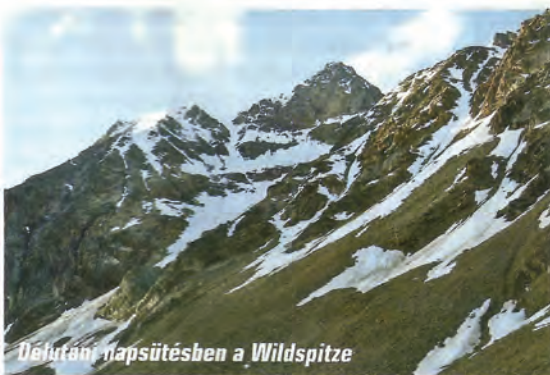
Délutáni napsütésben a Wildspitze

éve, a Gran Paradiso megmászása után mi is felkerestük a nevezetes itáliai múzeumot.