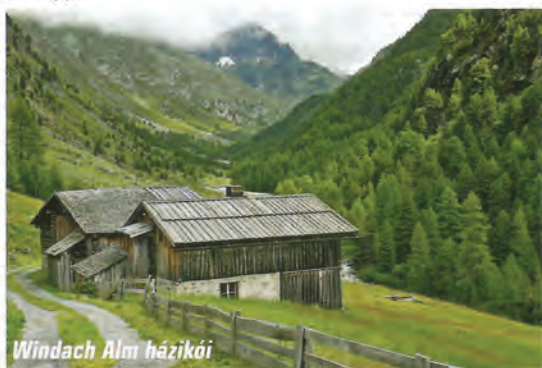
Windach Alm házikói