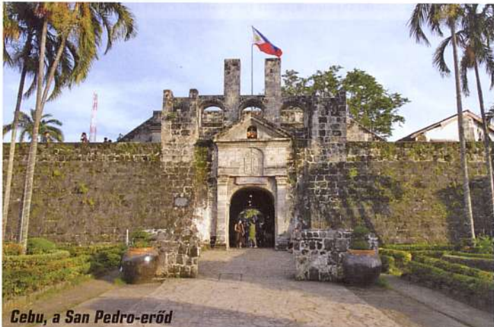
Cebu, a San Pedro-erőd