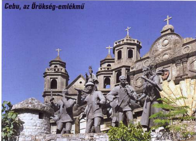
Cebu, az Örökség-emlékmű

De a Fülöp-szigeteken, így Boholon és Cebun tett látogatás nem az épített látnivalókról szól. Ide inkább azoknak érdemes eljönni, akiket a tenger élővilága, a karszthegek, a barlangok és a vízesések vonzanak.