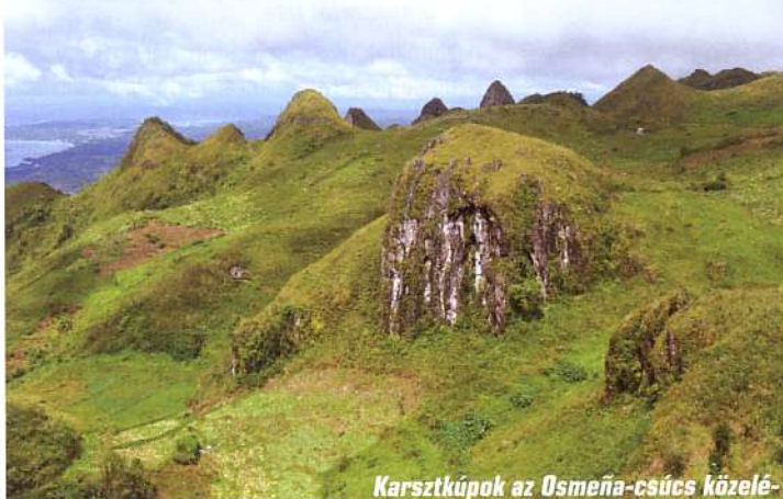
Karsztkúpok az Osmeña-csúcs közelében

belseje kínál látnivalókat. A településtől északra a tengerben meglepő alakú, gomba formájú sziklák dacoznak a hullámokkal. Az erózió a