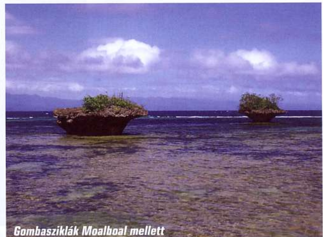
Gombasziklák Moalboal mellett