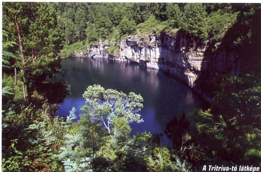
A Tritriva-tó látképe

méretű faj, az Alfred Grandidier francia természettudósról elnevezett Grandidier baobab. Egymás közelében álló több évszázados példányai között homokos út vezet, amit a prospektusok baobab sugárút-ként említenek. A helyiek tudni vélik, hogy a fák kerülete száz évenként egy méterrel növekedik. A sugárút néhány példányát több mint nyolcszáz évesnek tartják.