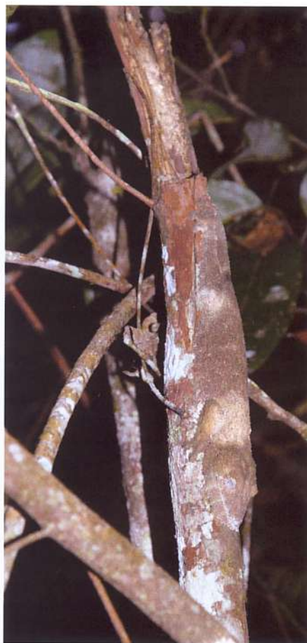
Rejtőzködő levélfarkú gekkó

kell megtennie ahhoz, hogy Madagaszkár, a nyolcadik kontinens biztos menedéket nyújtson különleges élővilága számára.