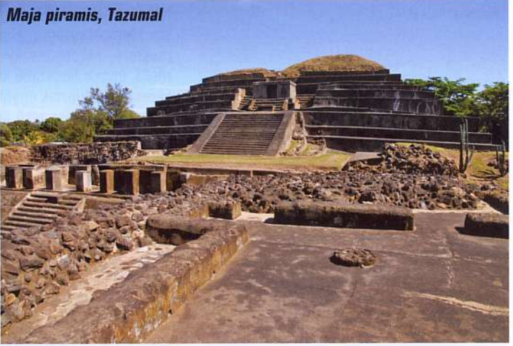
Maja piramis, Tazumal

természetes és több mesterséges csobogóból áll, strandfürdővel egybeépítve. Összességében nagyon mű, pedig szép kirándulóhely lehetne. Szerencsére visszafelé a Lago de Coatepeque felé vezetett az utunk, amit az ország legszebb tavának tartanak.