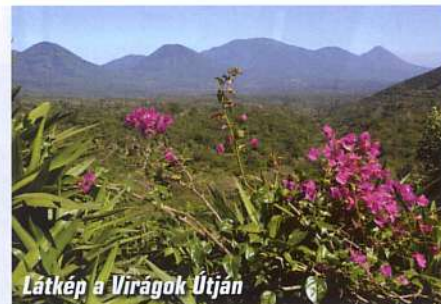
Látkép a Virágok Útján

A túlszűfolt El Salvadorban a földbirtokok nagy része néhány tehető család, a tizennégyek birtokában volt, az agrárország lakossága nem tudott hol gazdálkodni, és tömegesen menekült a szomszédos Hondurasba. A pattanásig feszült helyzetben került sor az 1970-es mexikói labdarúgó világbajnokságot megelőző selejtezőkre, melyben El Salvadort éppen Hondurassal sorsolták össze. Az első találkozóra Hondurasban került sor, a játékosok vegzálása miatt azonban El Salvador 1:0-ra elvesztette a mérkőzést. Az igazságtalan eredmény úgy felzaklatott San Salvadorban egy fiatal szurkoló lányt, hogy apja