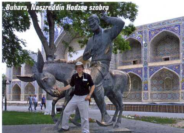
Buhara, Nasreddin Hodzsa szobra

Majd átkeltünk az Amu-darja hídján, és meg sem álltunk a néhai Aral-tóig. A fénykorában