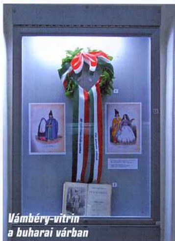
Vámbéry-vitrin a buharai várban

Magyarország neve nem ismeretlen az üzbégek számára. Amikor a helyiek honnan érkezünk kérdésére Magyarországot jelöltük meg, szinte mindenki rávágta: Budapest. Majd sokan hozzátették, Vámbéry. Azon viszont mi is meglepődtünk, amikor