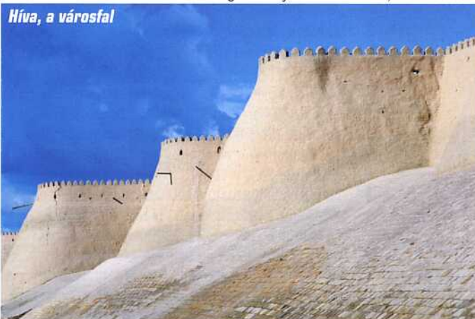
Híva, a városfal