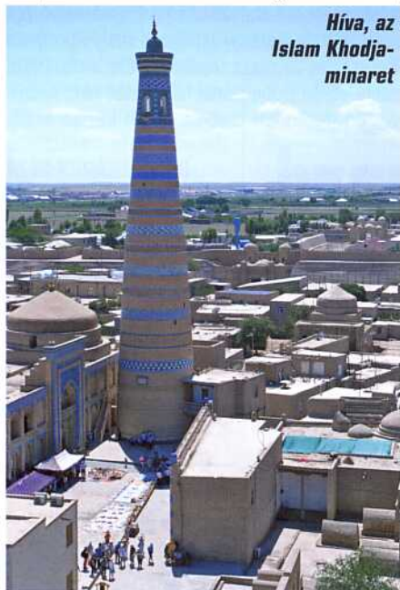
Híva, az Islam Khodja- minaret

„Hallottam, hogy a khán minden gyanús idegent rabszolgájává tesz, hogy csak nemrég tette ezt egy állítólag hercegi származású hindosztáni emberrel. De a veszedelmet már annyira megszoktam, hogy most sem vesztettem el a hidegvért, hanem azon eszközökről gondolkoztam,