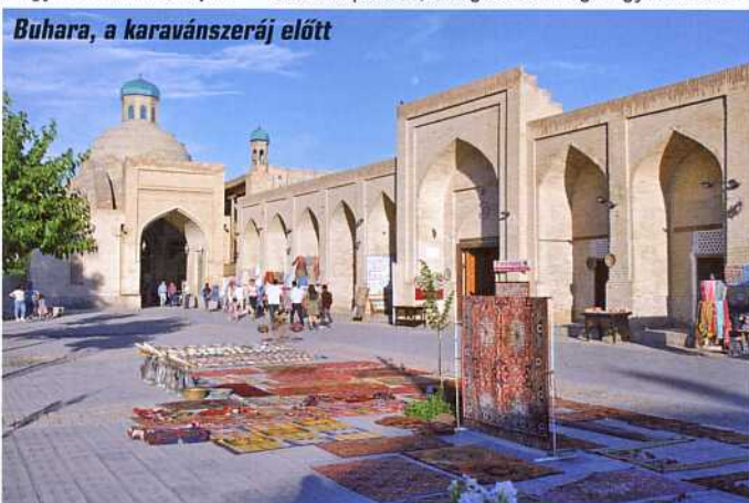
Buhara, a karavánszeráj előtt