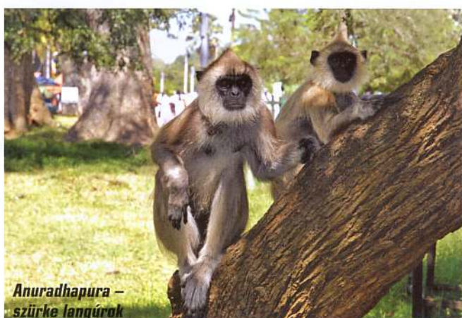
Anuradhapura – szürke langúrok