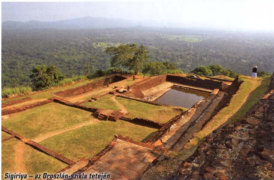
Sigiriya – az Oroszlán-szikla tetején

A szikla tetejéről pazar kilátás tárul a látogatók szeme elé, és megtekinthetők a fellegvár romjai is. Lefelé haladva még felismerhetjük a Tükörfalat, amit egykor olyan simára políroztak, hogy a király meglátta magát benne. A falon a régmúlt turistáinak írásait is felfedezhetjük, ezek mára önálló történelmi értékkel rendelkeznek. Némelyik vers vagy felirat a 8–10. századból származik. A szemközti falra a király idején hatalmas, 140 méter hosszú és 40 méter magas képgaléria került, az 500 freskóból azonban mára mindössze 22 maradt meg. Az Oroszlán-sziklától keletre nem hagyhatók ki a kertek sem, melyek a világ egyik legrégebbi tervezett kertjei.