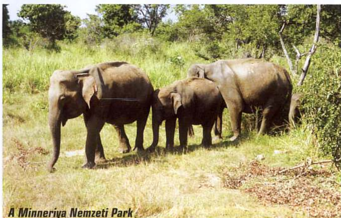
A Minneriya Nemzeti Park

A legtöbb látványosság belépőjeggyel látható, a helyeiknek azonban ez csak névleges árat jelent. A turisták számára bevezetett eltérő díjszabás miatt a legtöbb belépő ötvenszer – az Oroszlán-szikla esetén hatvanszor – annyiba kerül, mint a helyi belépődíj. A Pollonaruvában vásárolt jegyen a magyarázatot is olvashatjuk: „Minden bevételt, ami a jegyekből származik, Sri Lanka örökségének védelmére, megóvására és bemutatására fordítjuk.” Jó lenne, ha valóban így történe. ■