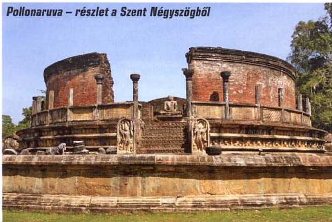
Pollonaruva – részlet a Szent Négyszögből