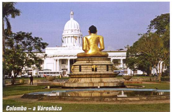
Colombo – a Városháza