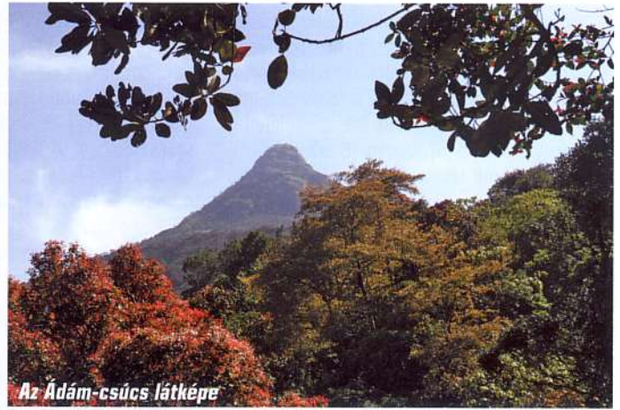
Az Ádám-csúcs látképe

és kilenc napi gyaloglás után ért a hegy lábához. Leírásában így számol be: „A régiek egy lépcsőfélélt vágtak a hegyoldalba, amelyen fölfelé mennek. A lépcsőbe vasölpököket vertek, ezekre láncot akasztottak, hogy megkapaszkodhasson benne, aki fölfelé mászik.”