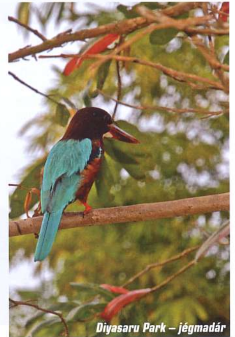
Diyasaru Park – jégmadár

A vallásos zarándokok évszázadok óta kapaszkodnak