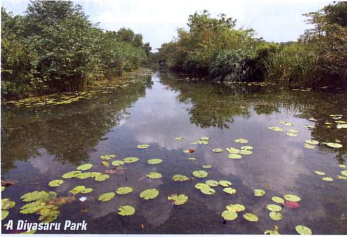
A Diyasaru Park