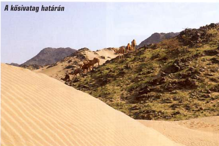
A kősvatag határán

A város határán túl a történelmi negyed, az At-Turaif emelkedik. Ez volt a királyi család eredeti otthona és az ország első fővárosa 1818-ig, ma pedig az UNESCO Világörökség