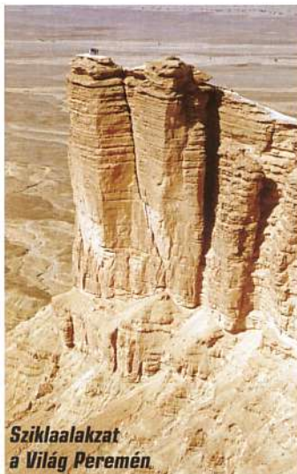
Sziklaalakzat a Világ Peremén

Korallokban, halakban persze nincs hiány, viszont búvárban és sznorkelezőkben sem. A mozgástér kevés, előtünk bójásor akadályozza