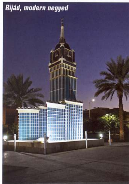
Rijád, modern negyed

A nagyvárosok közlekedése a turisták számára nehezen áttekinthető. A 7,5 milliós Rijádban még nem készült el a metró, a buszközlekedés gyér, mindenki kocsival jár. Megteheti, az üzemanyagárak szerények. Egy liter ásványvíz árából három liter dízelt lehet vásárolni. A látogatóknak marad a taxi, az uber és a Bolt,