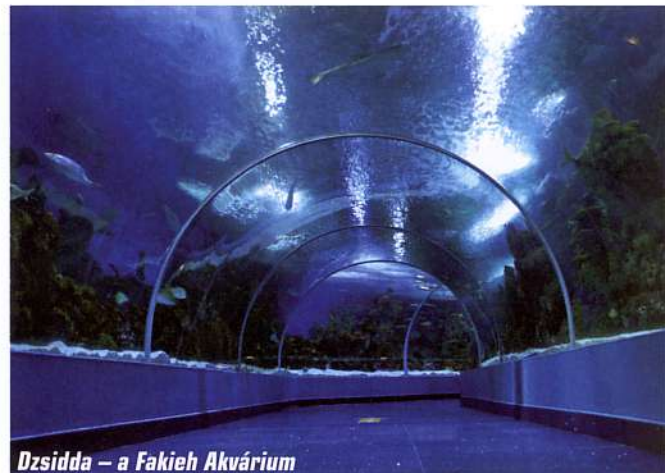
Dzsidda – a Fakieh Akvárium

A számok egyelőre nem ezt mutatják. A The Guardian 2021-ben publikált kiadványa alapján az ország bevételének 75 százalékát még mindig az olaj jelenti. Az embereken pedig nem múlna a siker. A szaúdi polgárok – éppúgy, mint a vendégmunkások – barátságosnak és segítőkésznek bizonyultak, bárhol is találkoztunk velük. Gyakran fogtak velünk kezét ismeretlenek vagy csak integettek felénk, és hozzátették: „Welcome to Saudi Arabia!”