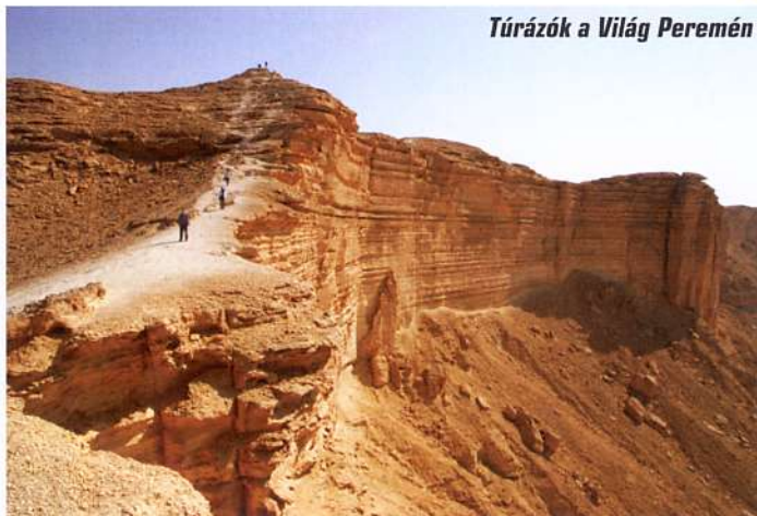
Túrázók a Világ Peremén