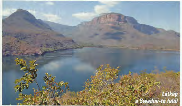
Látkép a Swadini-tó felől

jön és segít megkeresni a helyet. Ajánlatát szerencsére elfogadtuk, mert olyan úttalan utakon jutotunk el a szállásra, hogy nélküle talán még most is keresnénk. Az eldugott helyen olcsó, de tiszta kis hostelt találtunk, ahol a wifi olyan erősségű volt, hogy a telefonon kedvenc hírcsatornám tévéadását is megnézhettem.