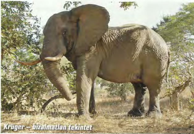
Krüger – bizalmatlan tekintet