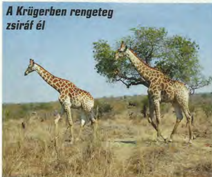
A Krügerben rengeteg zsiráf él

Szváziföld elhagyása után visszatértünk a Dél-Afrikai Köztársaságba, következett az ország legismertebb látnivalójának egyike, a Krüger Nemzeti Park. A park ismertetésével kapcsolatban nem kerülhetünk meg néhány adatot, ezek némelyike önmagában is figyelemre méltó. Közel 20.000 négyzetkilométeres kiterjedésével a Krüger nem-