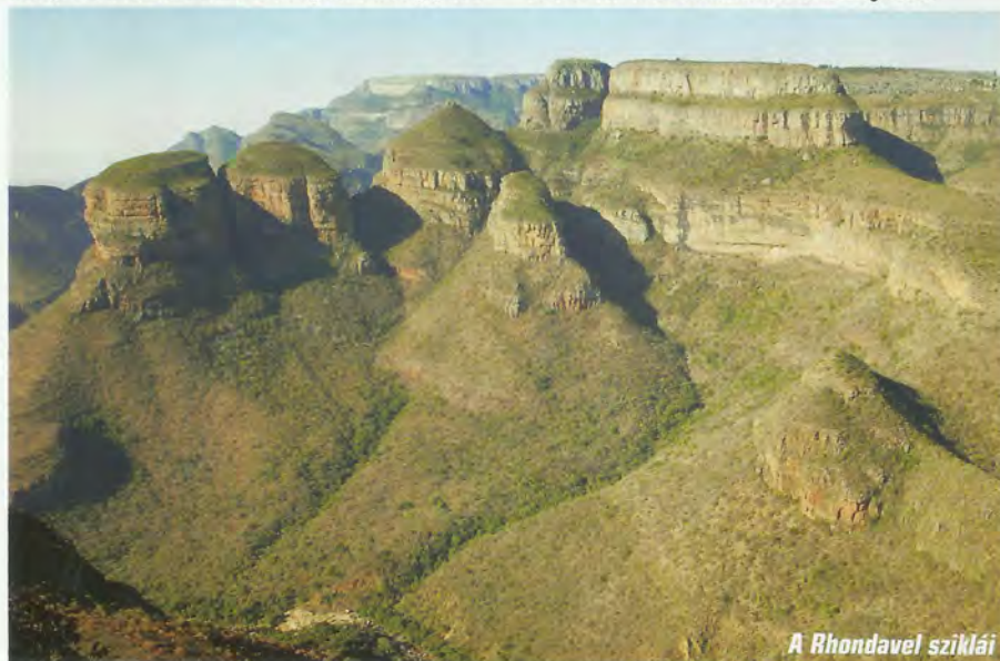
A Rhondavel sziklái

Ilyen előzetes információk alapján nyomorban élő, együgyű embereket képzel maga elé az utazó, a valóság azonban hamar rációfol erre. Többlépcsős, mégis gördülékeny határátlépést követően egyszerű, szerény, de semmiképp sem nyomorúságos falvakat láttunk, az iskolák ráadásul mindenütt kiváló állapotban voltak. Egyik helyen épp diákok festették a kökerítés feliratát, és büszkén mutatták nekünk, milyen precíz munkát végeztek. Rövidesen rendőr állított meg, aki az afrikai hadaró angolságához képest igazi irodalmi nyelvet beszélt. Gyors igazolvány-ellenőrzést követően udvariasan utunkra is engedett.