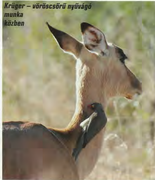
Krüger – vöröscsőrű nyúvágó munka közben

elárul a Krüger világról, mint a nevezetes fajok nevének és egyedszámának tételes felsorolása.